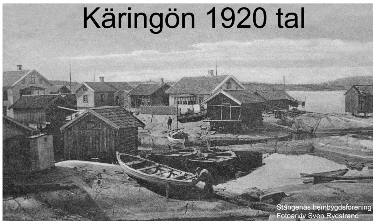
Fiskeläget Käringön i Bohuslän. 1920 tal

Kärandeombudet anmärker, att denna förklaring icke stämmer överens med vad svaranden vid 1797 års sommaring sig i saken yttrade, att han nämligen utan något förbehåll slutat handeln med ifrågavarande cabilcant för 6 riksdaler, 8 skillingar. Förmenandes kärandeombudet att brevet säkrast bestämmer handelns beskaffenhet och avancen överenskomna fördelning, så vitt den kunde bringas över de 6 riksdaler, 8 skillingar för tunnan, det Askenfeldt själv i sin handelsbok debiterat låtit, och som desto säkrare kan finnas, att enligt avtalet varan torde i Stockholm försäljas, helst käranden till försäljning i orten därav icke behövt sluta handel med någon annan. Då återopas uppå dessa och de förut andragna skäl, vad stämningen innehåller, och yrkas även ersättning för all i denna långvariga rättegång förorsakad kostnad med hemställning om icke svaranden med edgivning vill uppgiva avancens rätta belopp, såvida ej kärandens däröver författade räkning kunde godkännas. Men svaranden anmärker vidare att hans handelsbok, därur den käranden tillställda räkning är utdragen, icke blivit protesterad eller klandrad, och att den därför skall efter hans tanke böra lämnas vitsord.