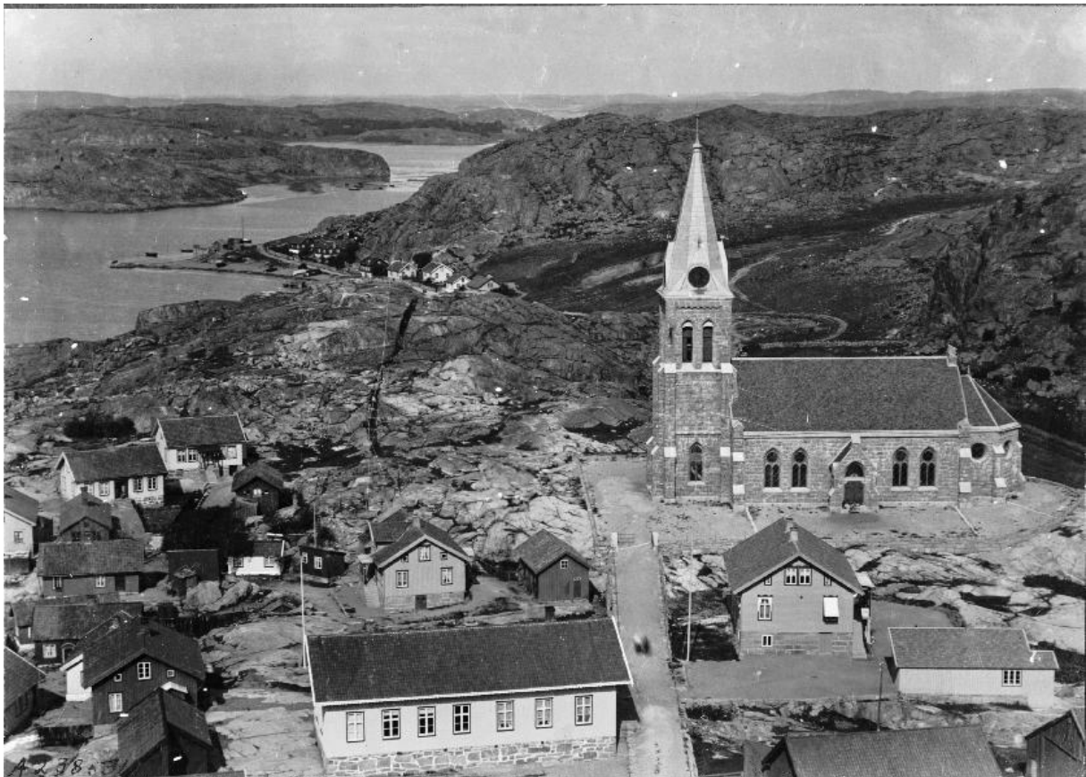
Fjällbacka i början av 1900-talet.

Vilket skedde i Broberg Anno Dei ut Supra."