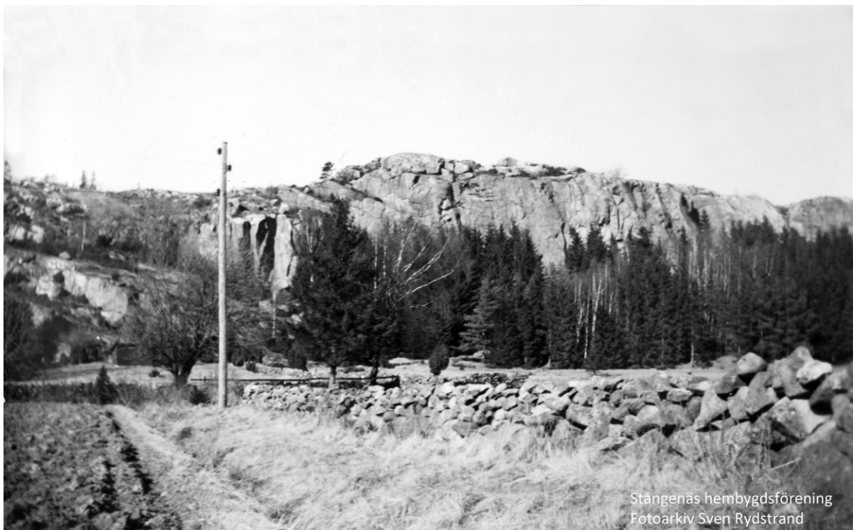
Stengärdesgård i Bro socken.