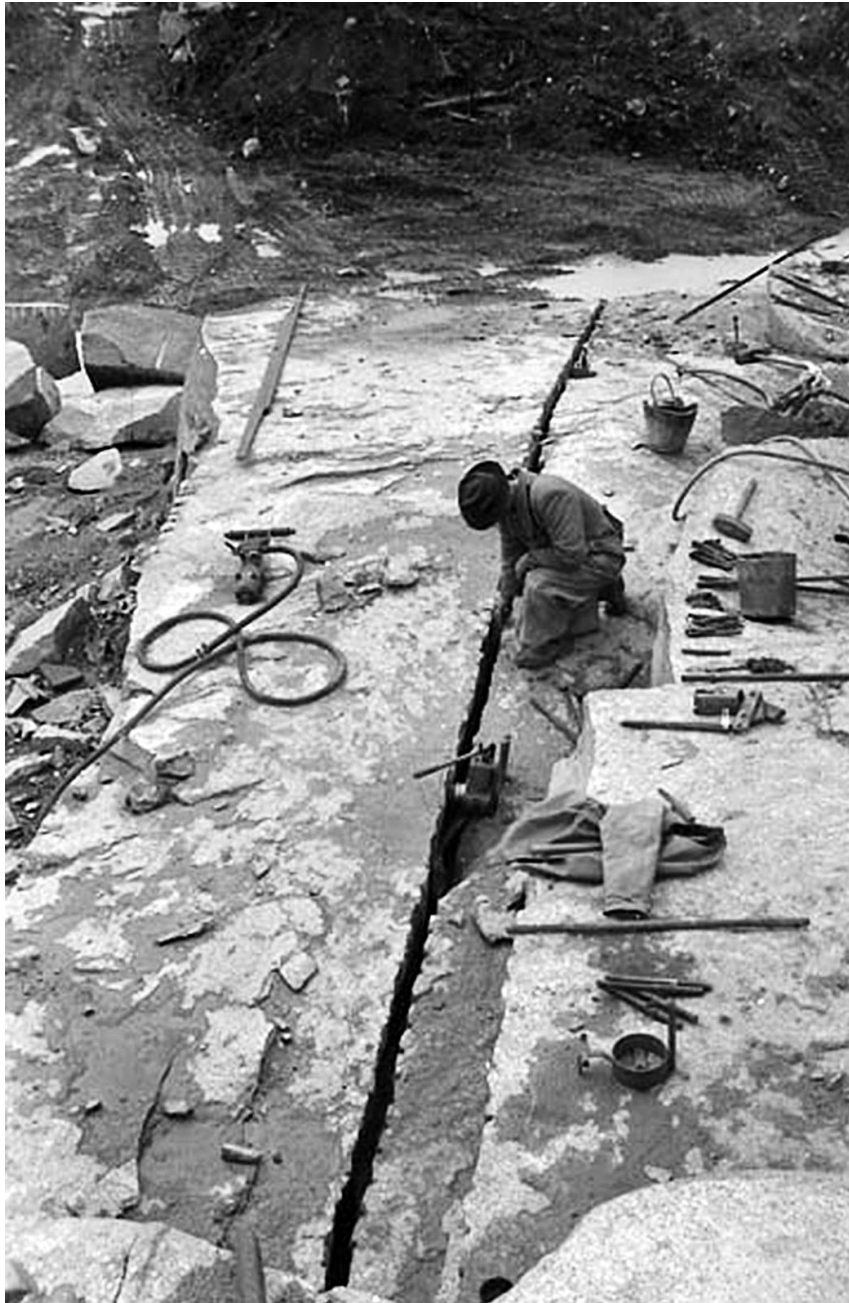
UMFA53318_0215 Rixö stenbrott 1966

Färdig hade fotograferat tusentals vyer från jordbruk och landsbygd, men han tyckte det fanns så bra motiv hos stenhuggarna. Speciellt trivdes han i Rixö där förvaltarna var snälla och stenhuggare lätta att prata med. Färdig berättade att han i sin ungdom slitit som bonddräng, men det slitet var ingenting mot stenhuggarnas.