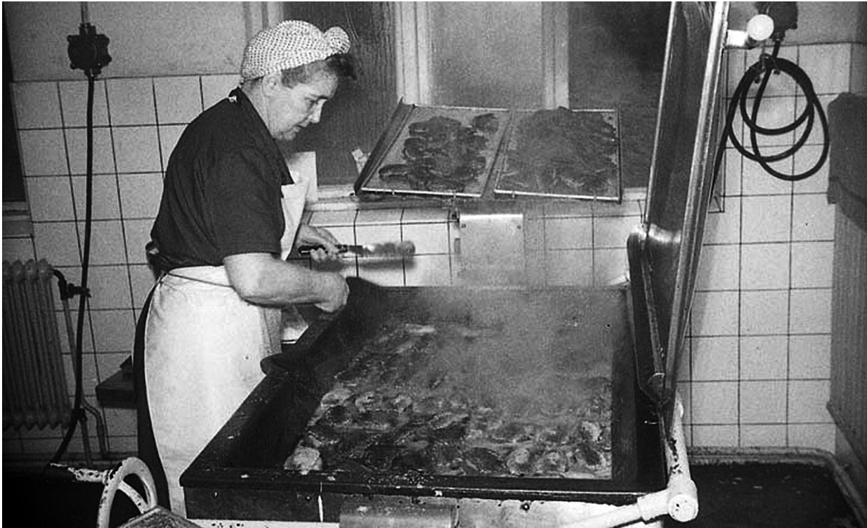
Foto Terje W Fredh UMFA53318_0356 Bohuslän museum Hjälmedals konservfabrik 1964 Florence Fors