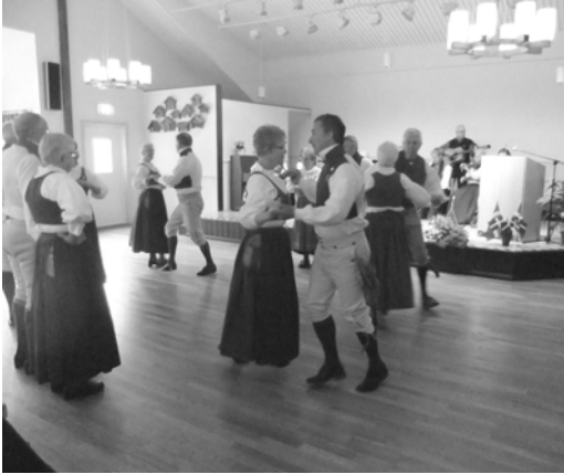
Häverödansare i Söderögården

Vid tangenterna och bakom kameran Bengt Skagersjö