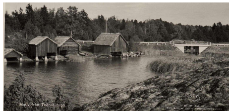
Tuskötäppan med Tvärnöbron och Skatberget till höger.

Här bodde min mormor och morfar på gården som ligger endast ett stenkast från sundet och här föddes min mamma och hennes syskon.