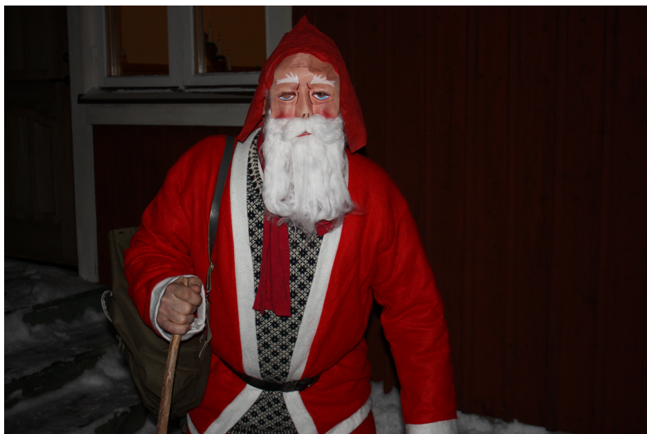
Bild från julfesten 2011 i Söderögården.

Hembygdsföreningen önskar Er alla en God Jul och ett Gott Nytt År!