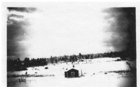
Bastun på 1940-talet