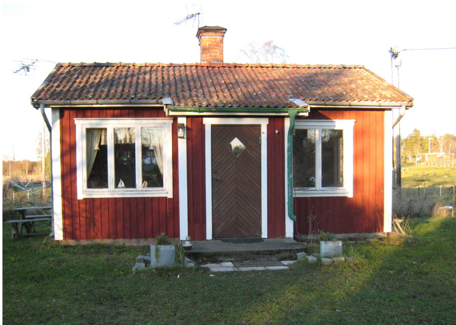
Ett hus med en historia

Medlemsblad för Söderöns Hembygdsförening