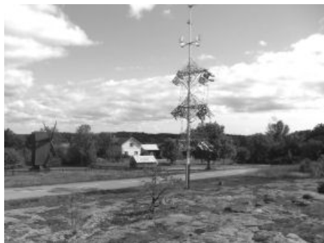
Äländsk majstång