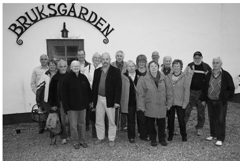
Gruppen framför Bruksgården

Detta har gjort att mycket har kunnat bevaras och kunde beses av oss.