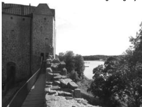
Utsikt från Kastelholms slott