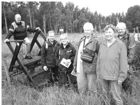
Morgonpigga vandrare

Trots värmen den tidiga morgonen var vi sju tappra vandrare som under Viveka Westmans ledning onsdagen den 13 juli kl 07 gick stigen från Långalmaskolan och mot en hägrande fika vid gistvallen nere vid Långalamafjärden.