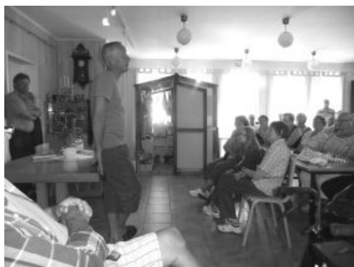
Information om Önningeby hembygdssförening