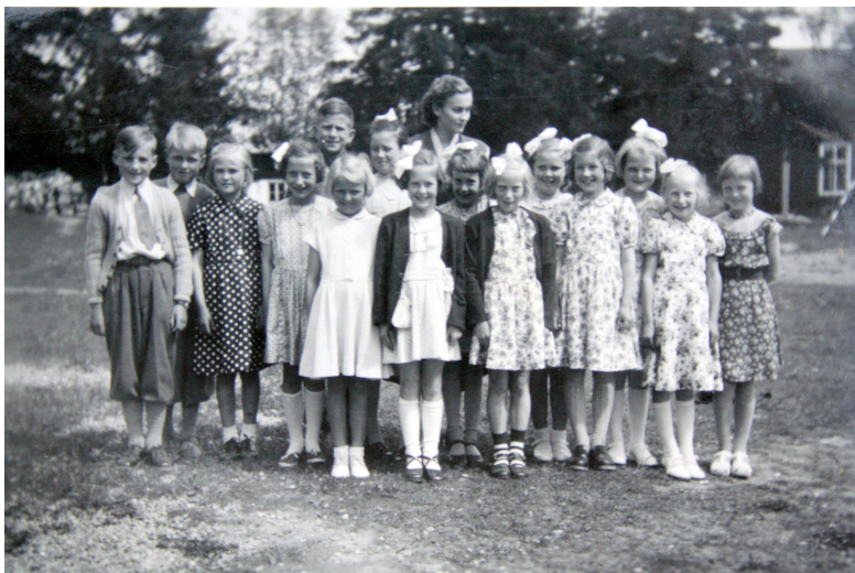
Examen i Yttersby småskola 1953, klass 2

Medlemsblad för Söderöns Hembygdsförening