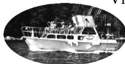
M/S Jenny af Öregrund bilden tagen från nätet