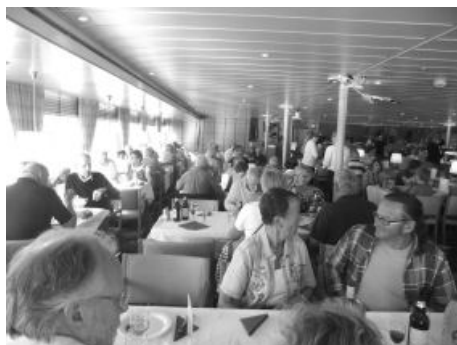
Förtäring på färjan