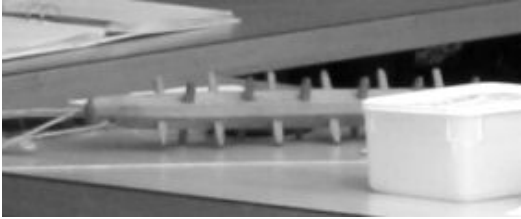
Segelsömmarhandske, sänke och anordningen mellan parhästar