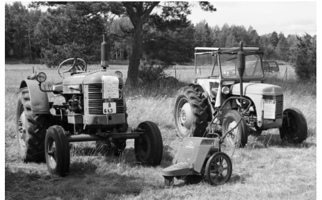
Mopeder, en gammal fin AJS, och traktorer ställdes ut.