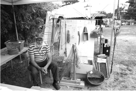
Bosse i vår monter