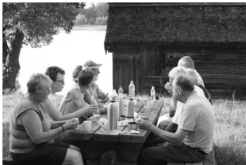
Fika vid gistvallen, mysig miljö en sommarkväll