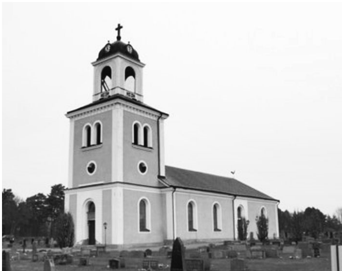
Börstils kyrka