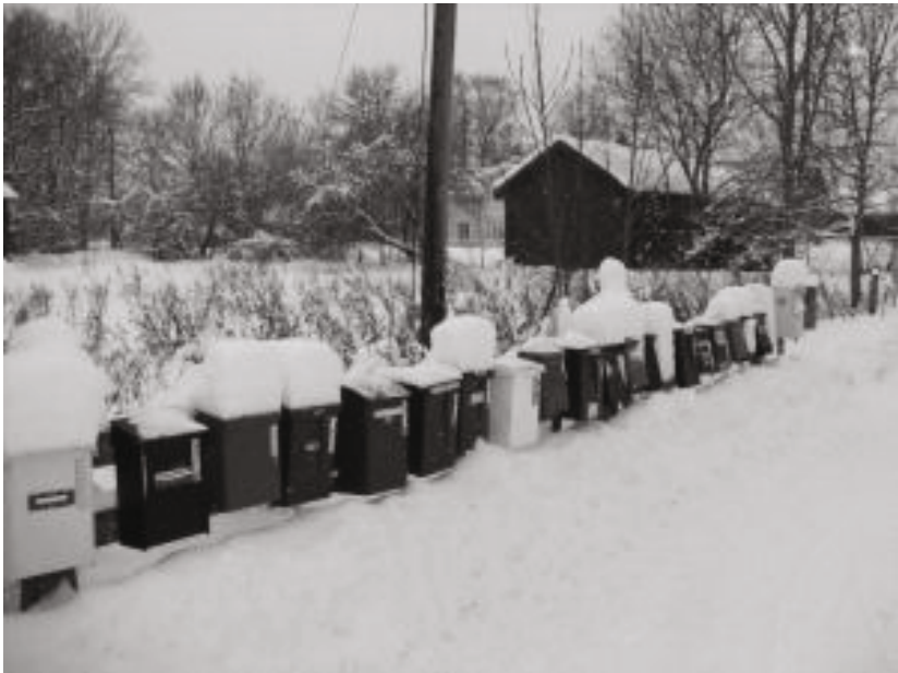
Vinterbrevlådor vid busskuren i Tuskö

Medlemsblad för Söderöns Hembygdsförening