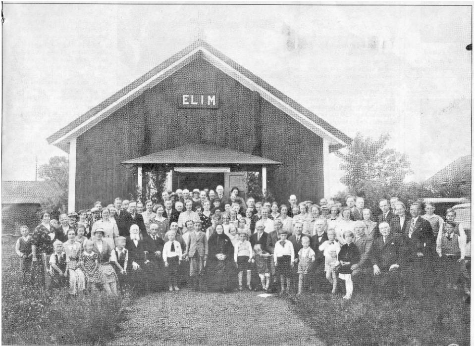
Fotografi från kapellets samlingar, taget i slutet av 30-talet.