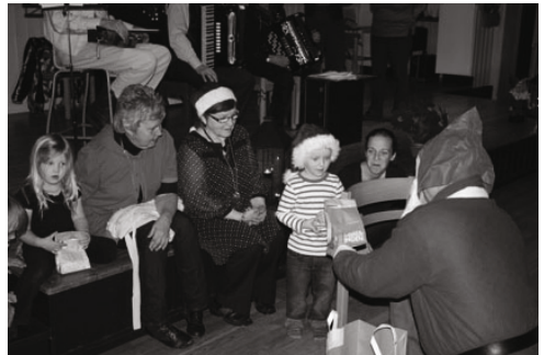
Tomten delar ut julklappar