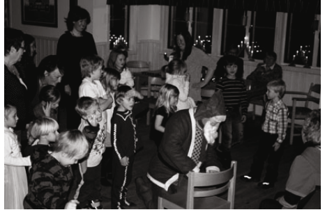
Tomten delar ut julklappar

En ung man frågade tomten hur gammal han var, tomten alltså.