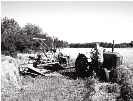
Lasse med självbindarekipaget

Dom fick väl bara komma in i hytten när man hämtade ny sand, annars var det nog bistert.