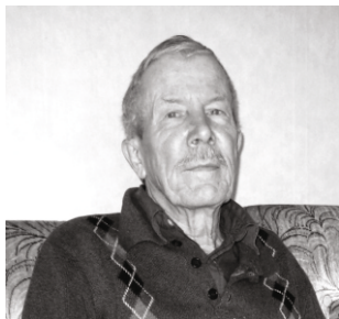
Per S

Utan under slutmanövern i lumpen skickade han med ordonnans till posten, in ansökan till lärarseminariet i Uppsala.