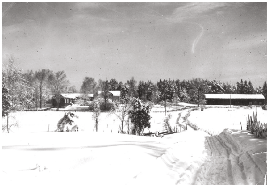
Lövnäs, affären i huset till vänster