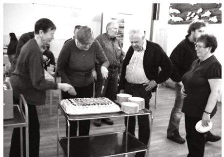
Vi låter oss väl smaka

Efter årsmötet vidtog förtäring. Mötesdeltagarna lät sig väl smaka av bl.a. härliga smörgåstårter, som