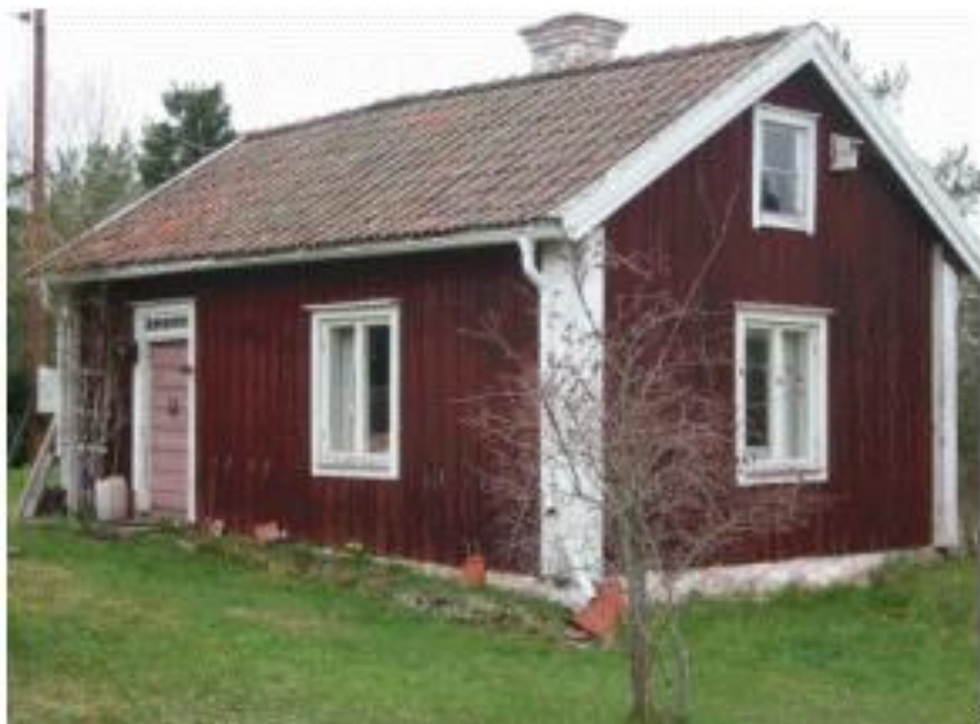
Björnäs båtsmanstorp nr 80