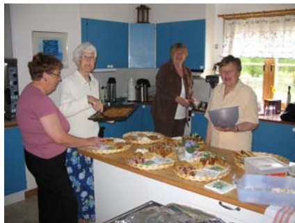
Förberedelser i köket

Till nästa års nationaldag hoppas vi att vi kan bjuda på en Söderöbakelse. Vi har utlyst en tävling och vi hoppas att vi kan presentera några bidrag på årsmötet och utse en vinnare. Ni är alla välkomna med förslag.