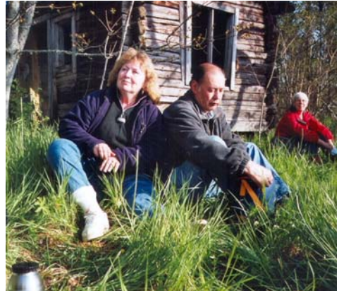
Vi njuter i solen