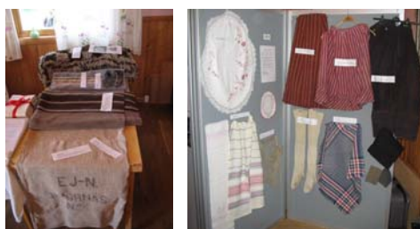
Föredömlig uppmärkning av textiliererna