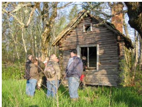
Klyx-Jans stuga

Efter information om stugans tidigare ägare fick Gunnar Emanuelsson ta över och fågelskådandet kunde börja. Lättast var det att känna igen tofsviporna och fasanen framför oss på åkern. Och sångsvanen som visade upp sig så fint på vattnet framför Lagerlund.