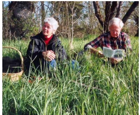
Vi njuter också i solen

Gökotta = morgontidig utflykt i det gröna, särskilt i maj när göken gal (Prismas lilla Uppslagsbok)