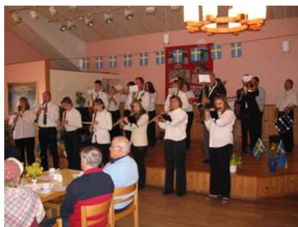
Blåsorkestern Al Fine