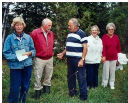
Här har vi samlats i det jättefina vädret