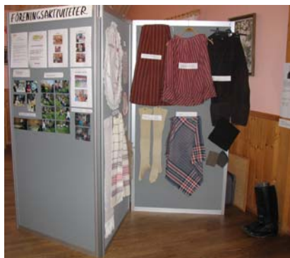
Vår utställningsskärm med föreningsaktiviteter och textilmontage