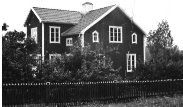
Marieberg, båtsmanstorp nr 81 (ombyggt)