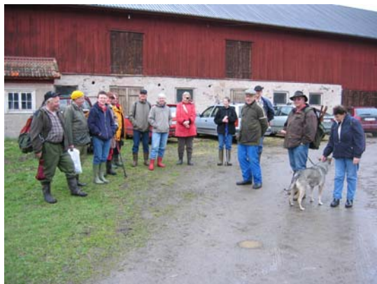
Samling före avfärd

Nolsterbygruppen träffas några gånger per år och ägnar sig åt någon aktivitet rörande byn. I april gjorde vi en byvandring från Hans-Olov Eriksson och till Vikarn.