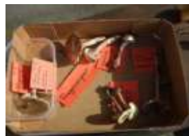
Farliga svampar

Lådan med dödskallemärkningar tilldrog sig stort intresse. Och som avslutning tog Vivi av locket på en plastask och förvisade några stinksvampar, varvid en vidrig doft spred sig runt Söderögården.