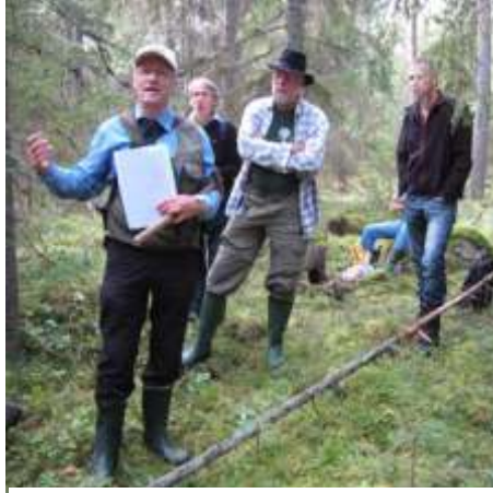
Arne S i berättartagen

Själva järnmalmåsden vid dessa gruvor är väldigt stark visar den flygmagnetiska kartan från 2009.