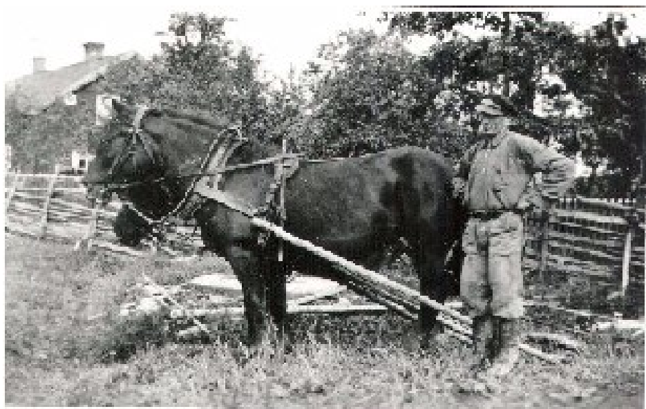
Mannen med hästen är Arvid Karlsson, Nolsterby Bilden tagen i början av 50-talet.