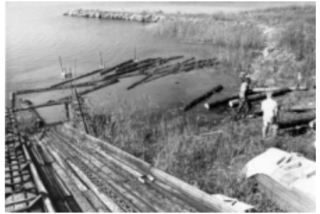
Här togs timret in ur föreningens bildarkiv

Timret togs in från sjön och måste alltså först rullas ner i vattnet utanför sågen. Därifrån krävdes två man i båt för att få in timret mot timmerspelet. En man stod vid timmerspelet och såg till att stockarna låg rätt när de drogs upp till sågen.