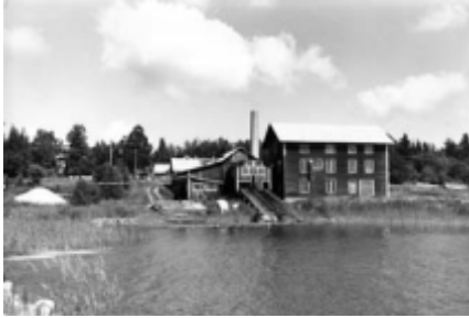
Älvsnäs Kvarn och Såg

Nästan längst ut på Söderön, vid Älvsnäs har det funnits både affär, bageri och två aktiebolag. Det ena bolaget var ångbåts-bryggebolaget och det andra Älvsnäs kvarn och såg.