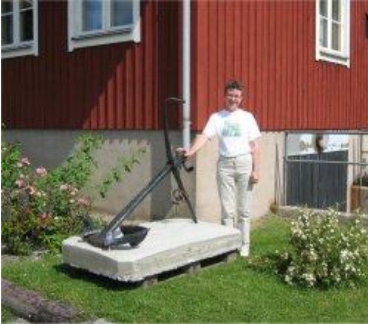
Viveka E vid ankaret från den bärgade pråmen. Ankaret är nu uppställt utanför Söderögården.