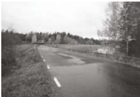
Karövägen mot bron

I förra numret av Söderöposten berättade jag om Söderövägens tillkomst. Nu till Karövägen, som är av betydligt yngre datum.