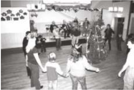
Dans kring granen.

Det var många som trotsade kylan (det var vinterns hittills kallaste kväll) och samlades i värmen kring granen i bygdegården.