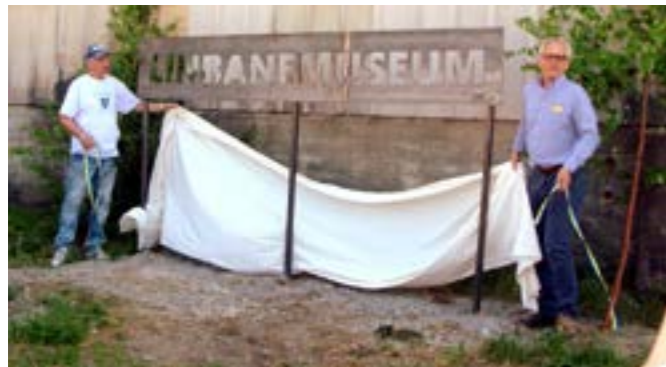
Läs om Linbanemuseet på Kalklinbanans hemsida. Se sid 16.