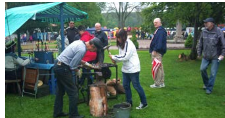
Bilden är från Gammaldags Malmköpings marknad där besökarna ofta är välkomna att delta och prova på.

Det är trevligt om så många dräkter som möjligt är representerade på området under dagen. Alla dräkter är