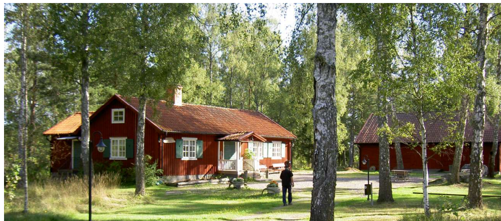
Södermanlands hembygd förbund 2020, www.hembygd.se/sodermanland

Kl 11-14 är museet öppet. Ingen servering pga epidemin. Vägbeskrivning på kalklinbanan.se. Kalklinbanans vänner, Eskilstuna kommun.