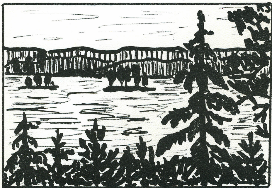
Utsikt över Stora Bötet.

TUNA HEMBYGDSFÖRENINGENS ÅRSSKRIFT 1985.