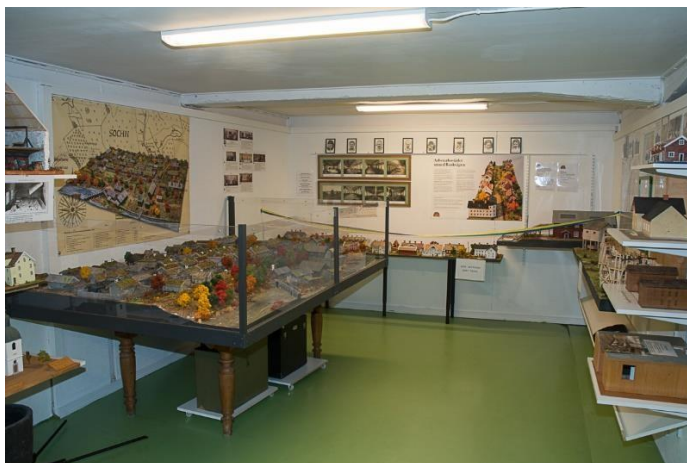
Modellrummet i Arkivhyttans Museum