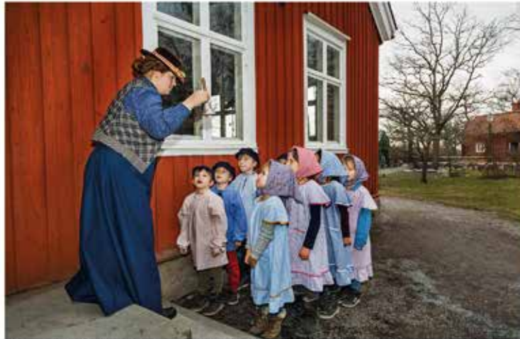
Väla skola på Skansen. Fröken ringar i klockan inför skoldagen. Väla är en socken i Västergötland, och barnen som gick i skolan bodde i byarna runt omkring. De var barn till bönder och torpare. Läs mer om Väla skola på sidan 8. Foto: Pernille Tøfte. Fotot skyddas av upphovsrättslagen och får inte användas av tredje part utan Skansens/fotografens samtycke.

Tidskrift för hembygdsarbete, natur- och kulturminnesvård utgiven av Västergötlands Hembygdsförbund Nr 5 Argång 75 2020