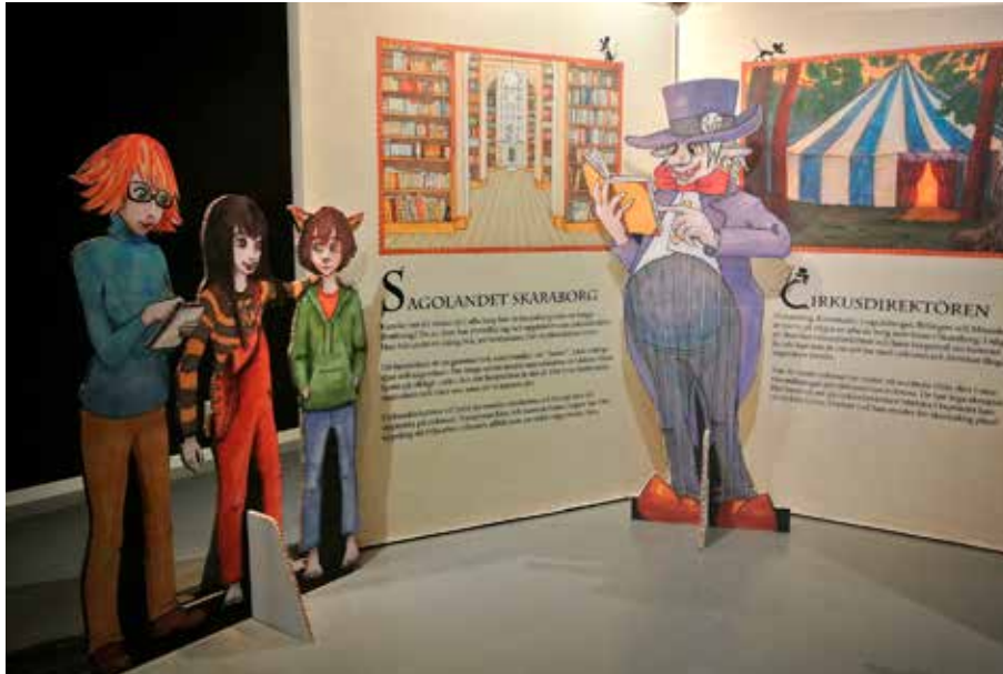
Sagolandet Skaraborg, sommarutställning 2020 på museet i Skövde.