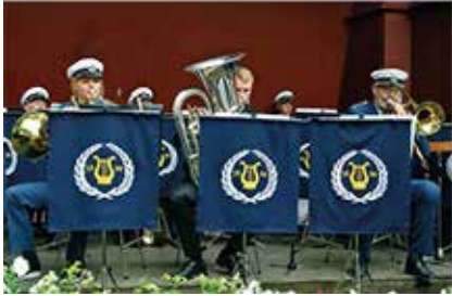
BILLINGSBYGDEN Årgång 46 2020