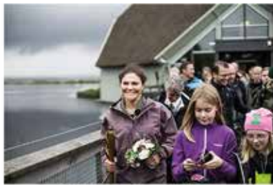
HKH Kronprinsessan Victoria Västergötlands Hembygdsförbunds beskyddarinna

Bilden ovan är tagen vid Kronprinsessans vandring i Västergötland i september 2017.