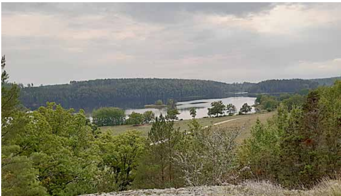
Utsikten från skansen mot sjön Valdemaren. Enligt vissa väderprognoser eftermiddagen bjuda på regn. Men denna dag var vädergudarna på sitt goda humör. De täta molnen lättade som synes.