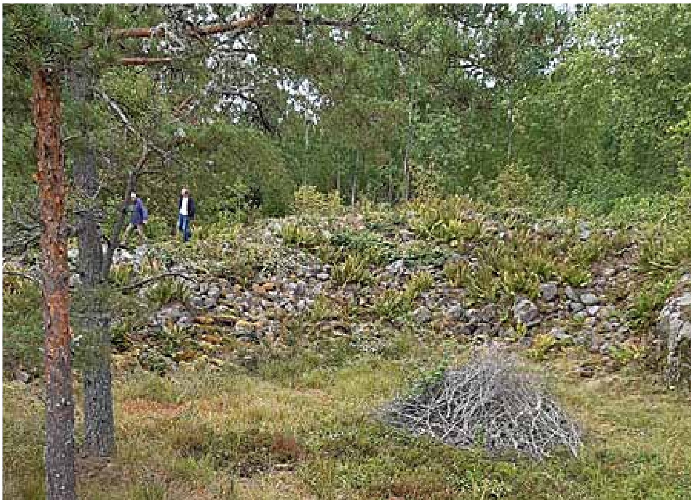
Här syns tydligt den med sten byggda muren mot norr.