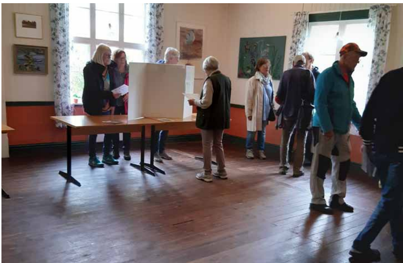
Utställningsskärmarna var vända mot ljuset från fönstren.