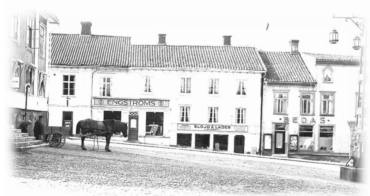
Ulricehamn. Stora Torget