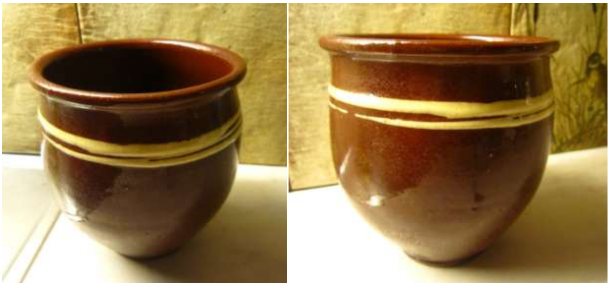
En kruka som skall vara av Vennerstens tillverkning.

Johan Gustaf, f. 16/8 1834 i Grinstads socken