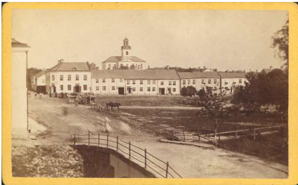
Åmåls torg vid 1870-talet.

Under 1700- och början av 1800-talet var Åmål indelat i fyra områden som kallades kvarter. Det var dock inte fråga om kvarter i den bemärkelse som man nu för tiden förknippar med detta begrepp, utan i stället något som möjligtvis kan benämnas stadsdel. 1:a kvarteret bestod till exempel av de egentliga kvarteren Kronan större, Kronan mindre och Vimpeln samt några enstaka gårdar. I det som kallades 2:a kvarteret fanns bland annat Liljan större och Liljan mindre och i 3:e kvarteret till exempel Älgen och Telegrafan samt i 4:e (Hamn-) Viken.