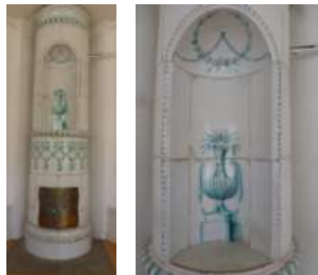
Kakelugn i Örby prästgård.

Skene var dock en av de få orter på landsbygden där dessa hantverkare tilläts slå sig ned och utöva sitt yrke. Möjligtvis beroende på den goda tillgången på lämplig lera i denna trakt. Denna lera har därefter gjort att det under åren fram till mitten av 1900-talet funnits ett flertal kruk- och kakelmakare med verksamhet i Skene.