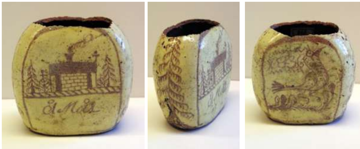
Ett något demolerat dryckeskrus med texten "Åmål" på den ena sidan och årtalet "1836" på den andra.