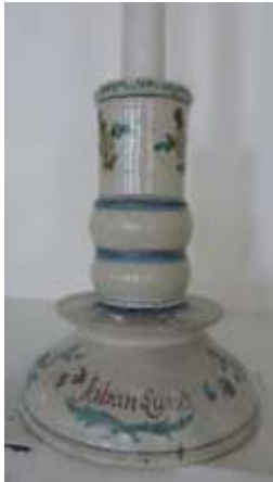
En av två ljusstakar vid Örby kyrka.

LUND, JOHAN. Inköpte den 14 aug. 1769 mäster Nils Friedrich Holms i Skene by belägna verkstad med tillbehör och mästarerättigheter för 850 dlr smt. Erhöll den 4 dec.1770 förening med ämbetet " med förbehåll att av denna Mästarerättighet ei taga anledning til at här i Staden sig nedsätta och Embetet med handtwerkens idkande intrång göra ".