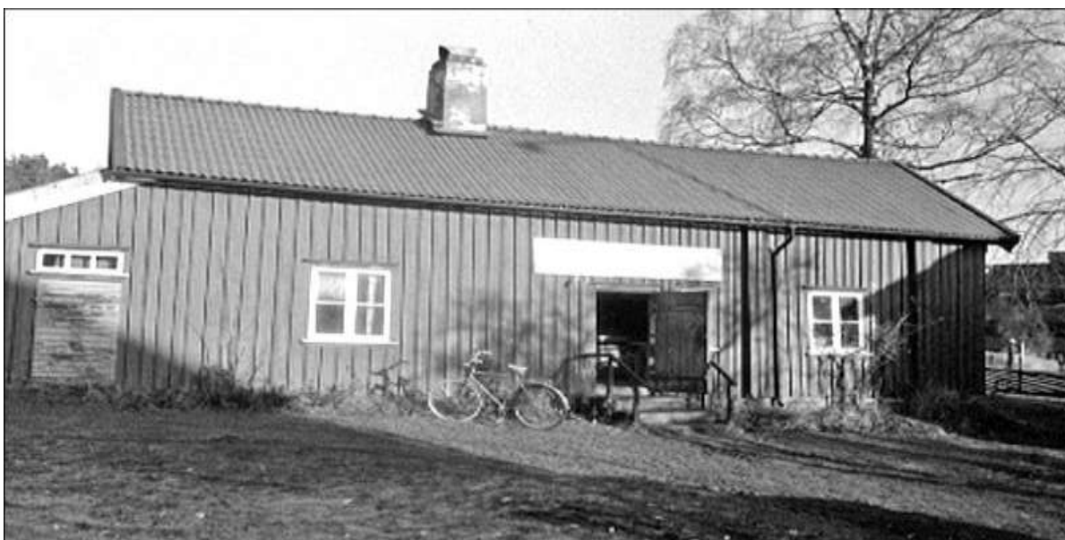
Anjougården på 1980-talet.

I boningshuset visas en mångfald exempel på vad som tillverkats under åren. Anjougården är öppen onsdagar under juli månad i samband med våffelcafé, men även vid andra tider finns det tillfälle till ett besök. Närmare upplysningar går att få på Skene-Örby hembygdsförenings hemsida.