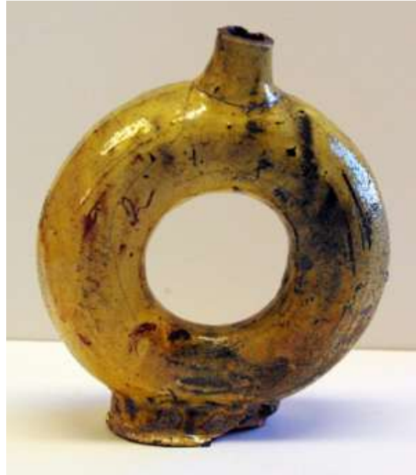
Brännvinsplunta som förmodas komma från Åmål.