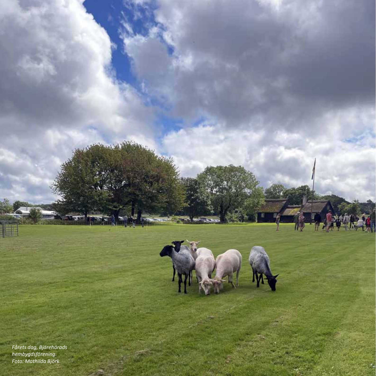
Fårets dag, Bjärehärads hembygdsförening.