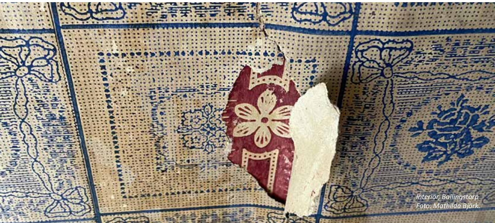
Interiör, Ballingstorp