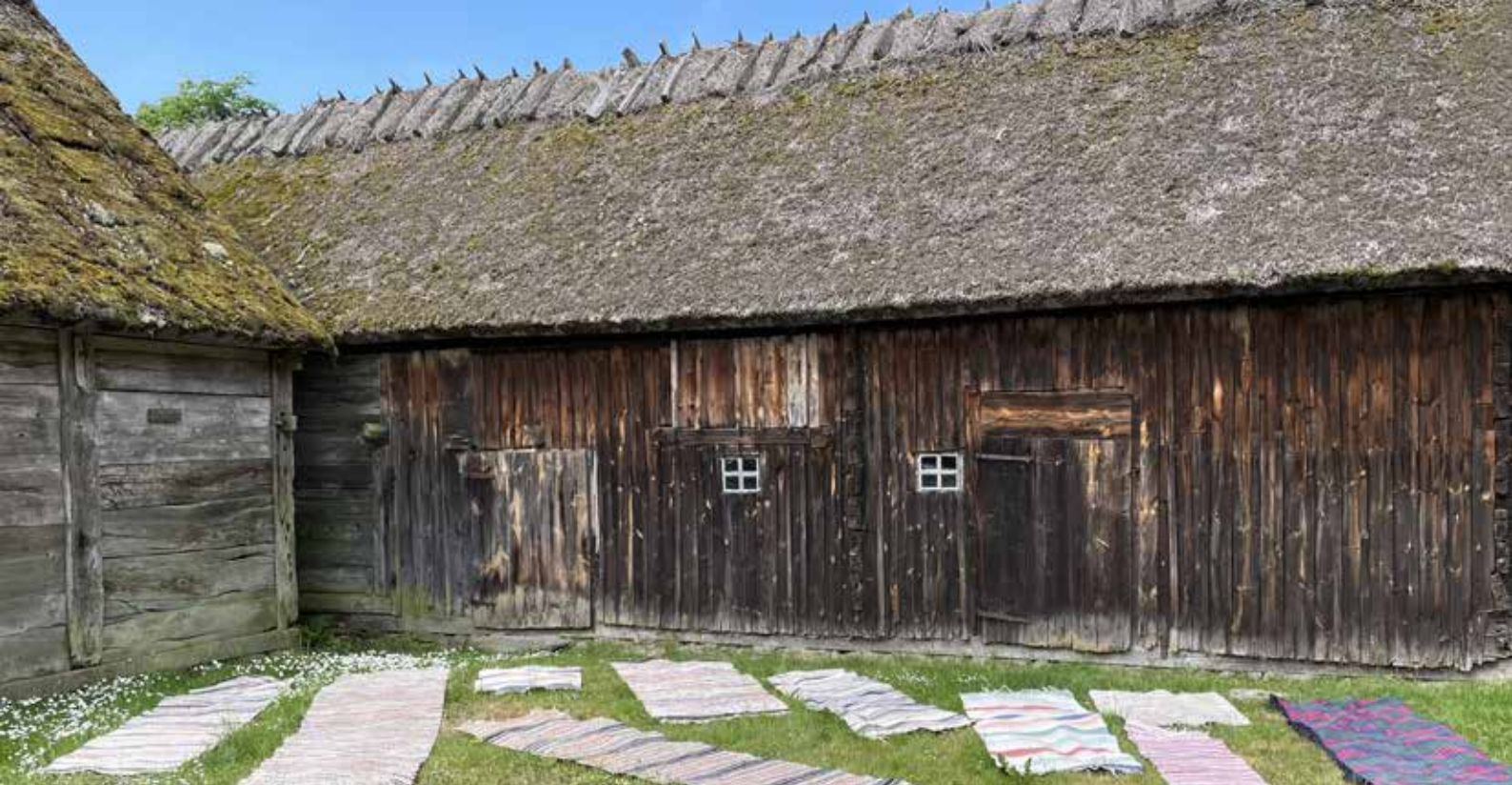
Städdag på Ballingstorp i maj.

hantverkare, antikvarie och värdparet Letin. Förbundet söker årligen medel från länsstyrelsen för byggnadsvård, publik verksamhet och information samt för markskötsel. Eftersom Ballingstorp är ett byggnadsminne erhålls 90 % av kostnaderna för underhållet av byggnaderna. Underhåll görs enligt en vård- och underhållsplan som upprättats av Kulturen i Lund 2015. Knadriks Kulturbygg AB anlitas för underhållsarbetet. Under 2024 fick PerOls-gården en ny innervägg. Markerna och trädgården sköts i enlighet med skötselplaner utformade av Länsstyrelsen respektive Regionmuseet Skåne. För markskötseln anlitas Lars Winkvist. Betesmarkerna betas av 3-4 ungdjur från Dammgården i grannskapet (Oscar Carlsson).