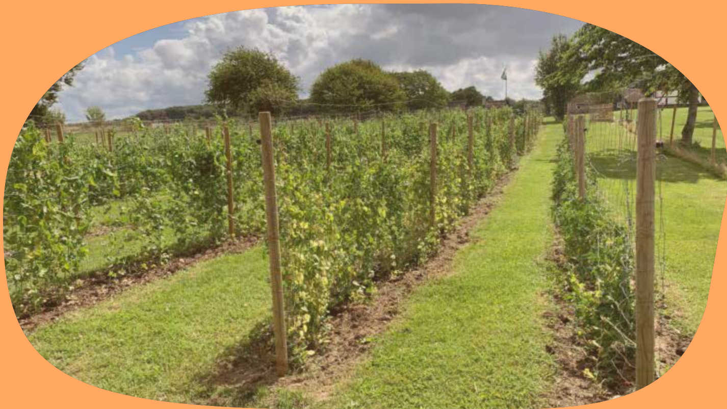
Odling av kulturgrödor, Bjäre härads hembygdsförening