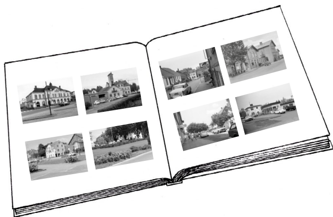
Teckning av ett fotoalbum. Ritad av Johanna Nessow, Skånes Arkivförbund.

Ett annat sätt att jobba med äldre fotografier är att ge eleverna i uppdrag att leta upp platserna utifrån motiven på fotografierna. Eleverna kan få i uppgift att leta upp och fotografera samma plats idag. Då kan ni tillsammans gå igenom varje plats och fotografi och diskutera utifrån frågorna ovan.