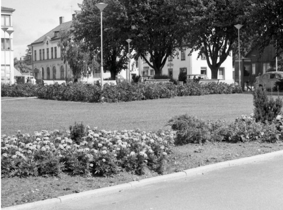
Nya Torg i Höör. Foto: Börje Nilsson, 1950-tal, donerat till Höörs kommunarkiv.