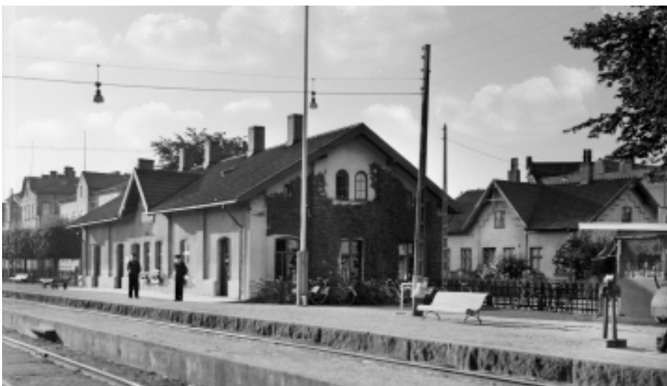
Skurups järnvägsstation cirka 1936.

När järnvägen kom till orten var det en festens dag! Järnvägsstationen invigdes med pompa och ståt. Landshövdingen var säkerligen där, kanske till och med kungen. Hela samhället var samlat för att fira. Regementets orkester spelade, det åts och dracks och hölls tal.