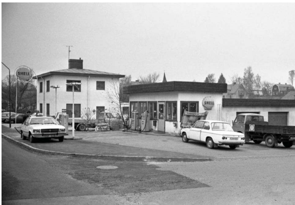
Shellmacken i Höör. Foto: Börje Nilsson, 1950-tal, donerat till Höörs kommunarkiv.

Vid stoppet på Storgatan i Höör tog pedagogen också upp att många svenska städer har en gata med namnet Storgatan. Dessa gator fungerade i regel som städernas huvudgator. De var hjärtat i affärsverksamheten och huvudled för genomfartstrafiken. Eleverna uppmanades att reflektera över hur och varför gatan har fått sitt namn? Och vilka slags verksamheter och butiker kan ha präglat Storgatan och dess betydelse för stadens centrum? Är det på samma sätt idag?