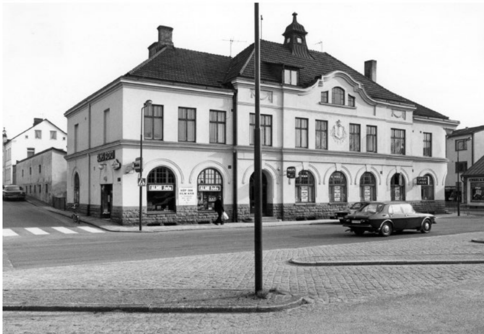
Gamla bankhuset i Höör. Byggdes 1906, revs 1983. Foto: Börje Nilsson, 1950-tal, donerat till Höörs kommunarkiv.