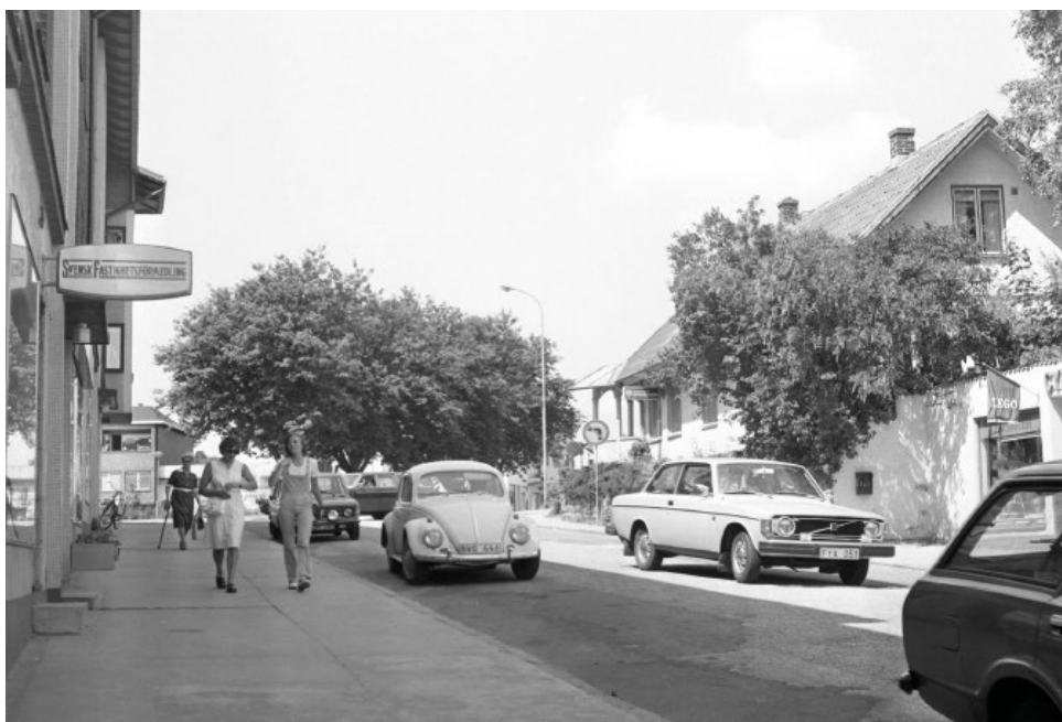
Storgatan i Höör. Foto: Börje Nilsson, 1950-tal, donerat till Höörs kommunarkiv.

Vid platsen där det gamla bankhuset en gång stod berättade pedagogen för eleverna om olika företeelser som var en del av livet i staden kring sekelskiftet. På den tiden bodde det ungefär tusen människor i Höör. Staden var då liten men full av olika företag och platser som hjälpte invånarna: banker, skolor, hotell, butiker och olika hantverkare fanns överallt. Det fanns också olika sorters industrier som mejerier, verkstäder, stenhuggerier, väverier, vagnfabriker och till och med läskedrycksfabriker. Här kunde eleverna fundera över vilka slags arbeten människorna i Höör hade i de olika industrierna. Hur var det att arbeta på ett mejeri jämfört med att arbeta på en vagnfabrik eller ett stenhuggeri? Och varför finns vissa av dessa platser inte längre kvar idag?