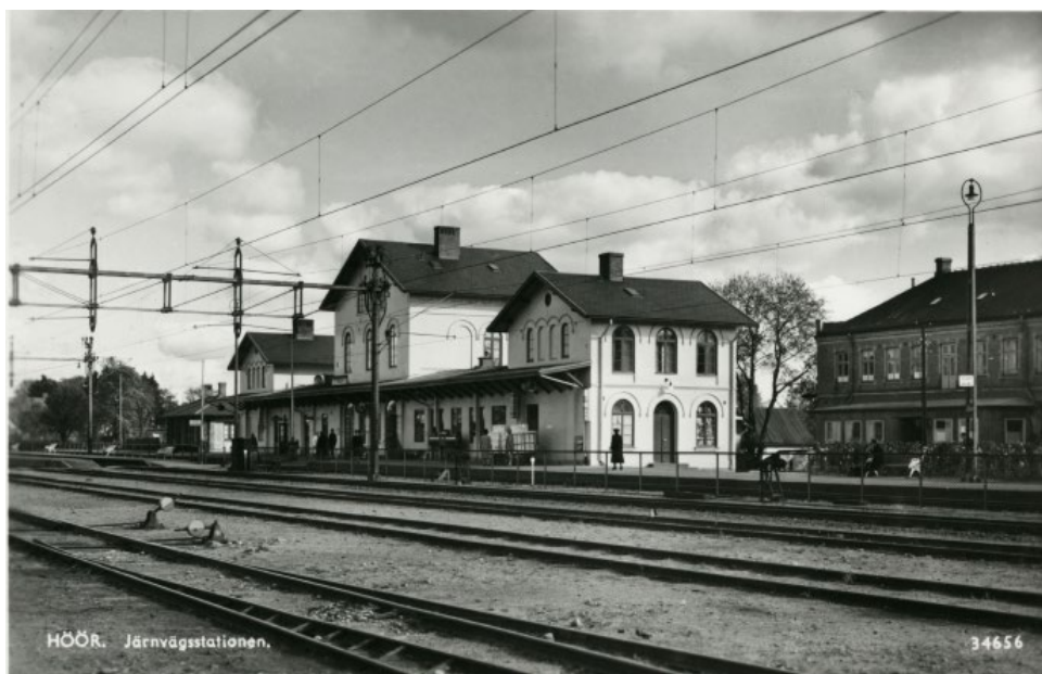
Höör järnvägsstation cirka 1938.

Eleverna fick möjlighet att fundera över hur järnvägen möjligen påverkade samhällen och de platser den passerade, och vilken betydelse den hade för människorna längs dess sträckning. De diskuterade varför enhetlig tid över hela landet var viktigt. Kanske kunde de även tänka sig situationer där olika tidszoner skulle kunna vara förvirrande?