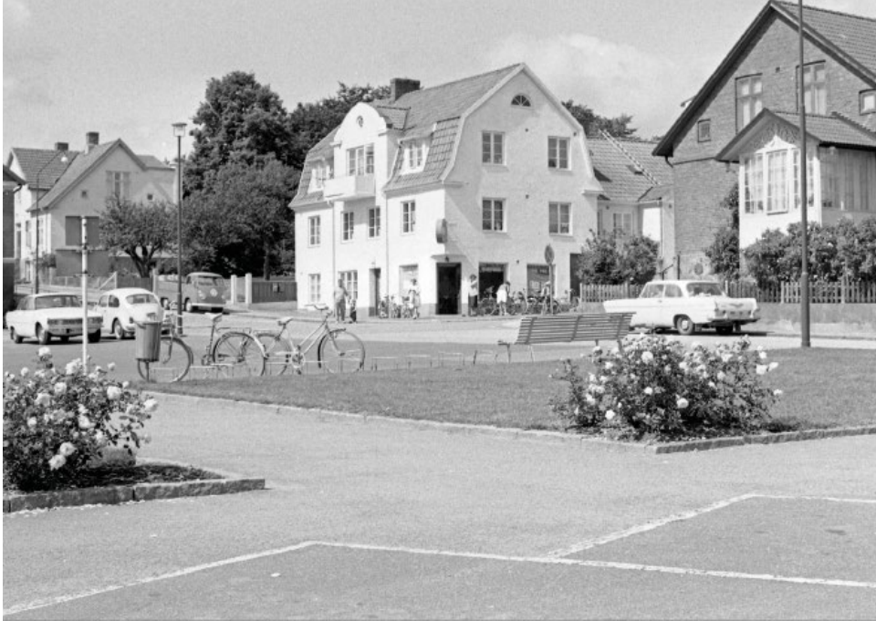
Lilla Torg i Höör. Foto: Börje Nilsson, 1950-tal, donerat till Höörs kommunarkiv.