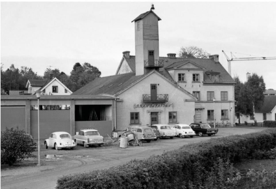
Gamla brandstationen i Höör. Foto: Börje Nilsson, 1950-tal, donerat till Höörs kommunarkiv.