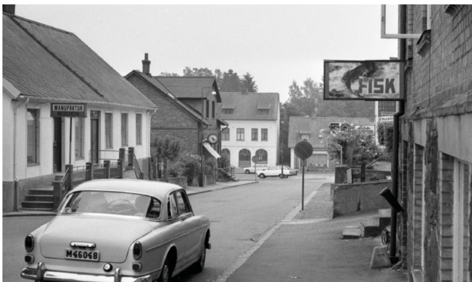
Kungsgatan i Höör. Foto: Börje Nilsson, 1950-tal, donerat till Höörs kommunarkiv.

Det sista stoppet på stadsvandringen var platsen där gamla brandstationen tidigare låg. Med åren blev brandstationen för liten och otillräcklig för att rymma dagens moderna brandbilar. Renovering eller ombyggnad hade blivit kostsamt. Istället beslutade man att riva den och bygga 30 nya lägenheter på samma plats. Eleverna fick möjlighet att jämföra platsen idag med det äldre fotografiet och reflektera över hur platsen har förändrats över tid.