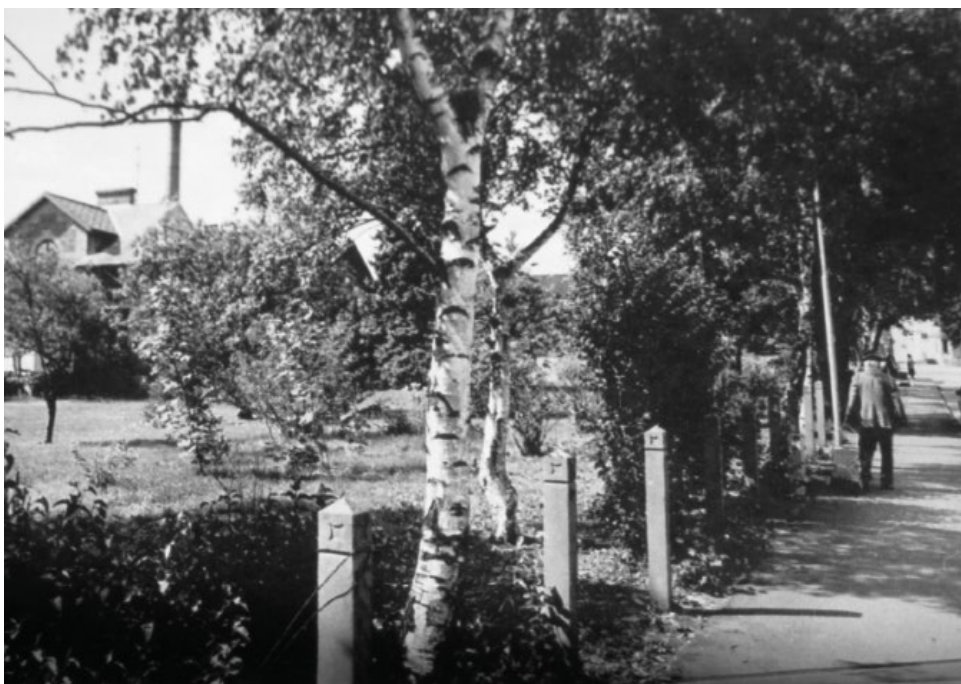
Utsikt vid mejeriet. Foto: Börje Nilsson, 1950-tal, donerat till Höörs kommunarkiv.

Eleverna fick här möjlighet att reflektera över mejeriprodukternas ursprung. Var kommer egentligen mjölken, smöret, osten och grädden, som de flesta av oss konsumerar i vår vardag, ifrån? För inte alltför länge sedan fanns mejerier i nästan varje större by. Dessa mejerier spelade en avgörande roll i det dagliga livet på landsbygden, och i många byar var de den enda formen av industri. Hur ser det ut idag?