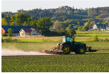
20/9 Odlingslandskapets berättelser