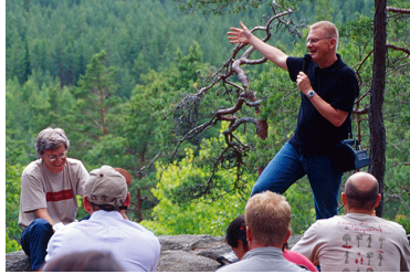
27/9 Nätverksträff om hembygdsrörelsens arrangemang och besöksmål