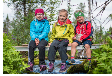
26/9 Så blir vi yngre: Vad innebär barnkonventionen i praktiken?