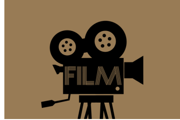
28/9 Inspiration om bild, ljud och film på Hembygdsportalen