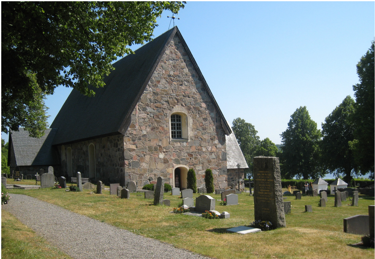
Länna kyrka i Uppland.