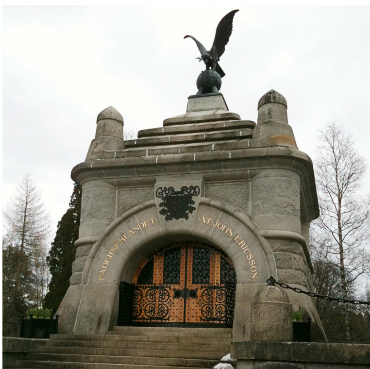
Den svenske uppfinnaren John Ericssons gravkapell i Filipstad.