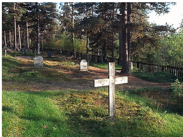
Begravningsplats i Porjus. Många på 1800-talet fick nöja sig med ett enkelt träkors.