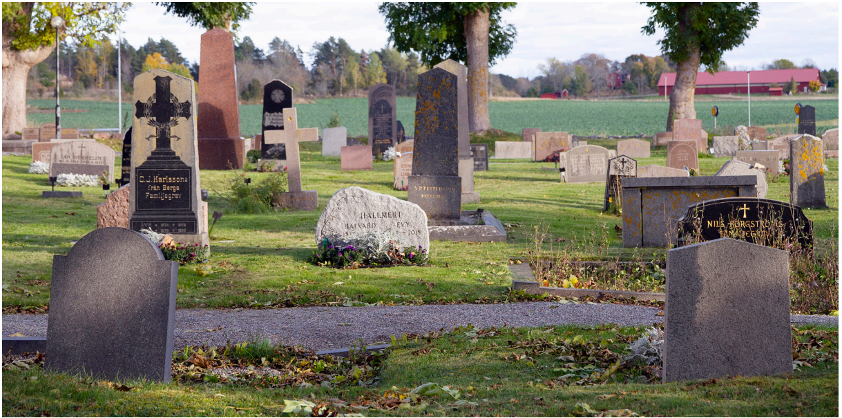
Kyrogården vid Skå kyrka på Färingsö i Stockholms län.

begravningsplatsens värden ska tillståndsprövas av länsstyrelsen enligt 4 kap. KML.