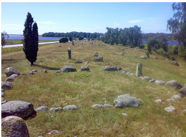
Gravfält från Järnåldern i Hjorthammar, Blekinge.