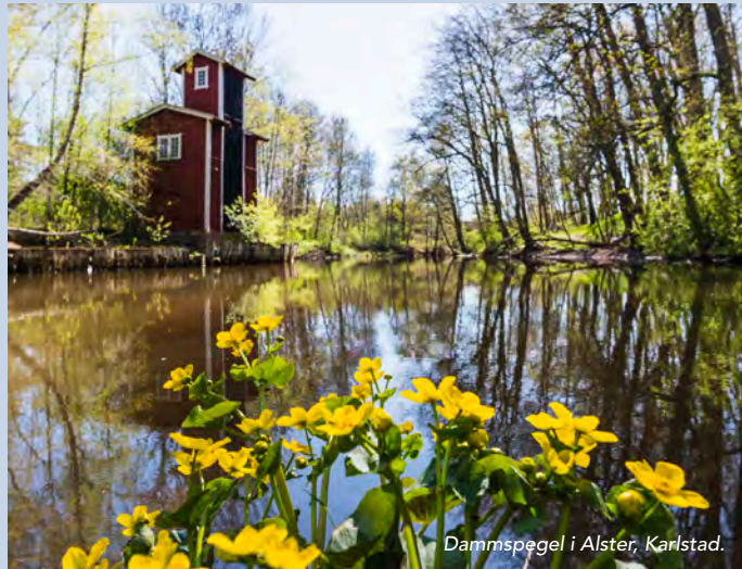
Dammspegel i Alster, Karlstad.