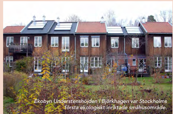
Ekobyen Understenshöjden i Björkhamnen var Stockholms första ekologiskt inriktade småhusområde.