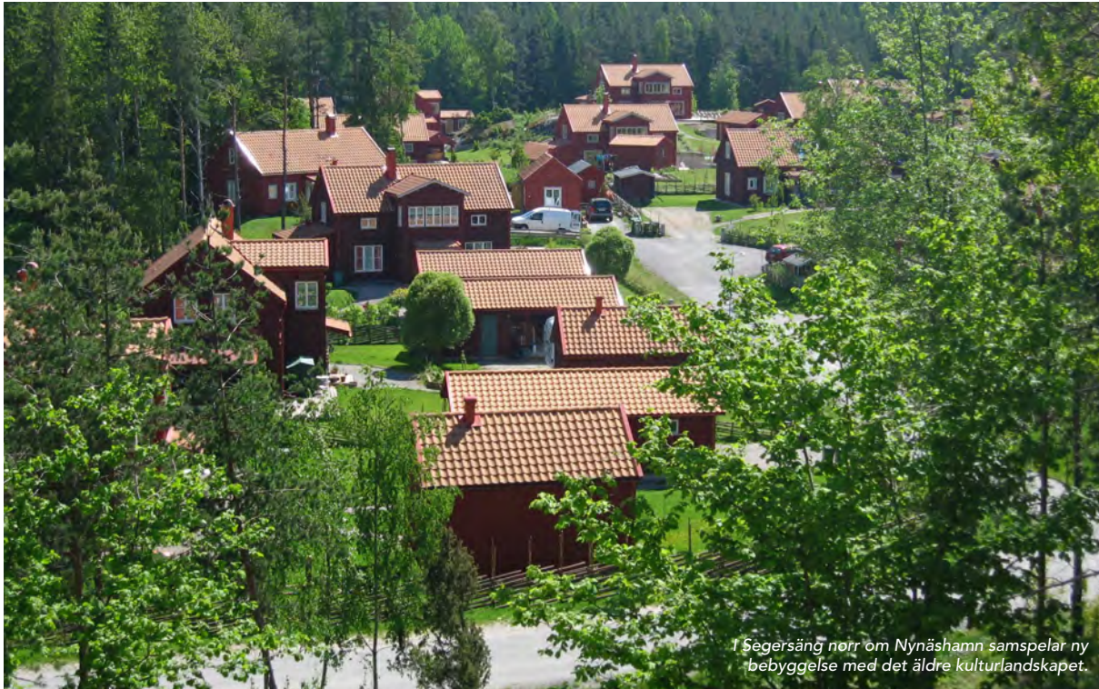
I Segersång norr om Nynäshamn samspelar ny bebyggelse med det äldre kulturlandskapet.