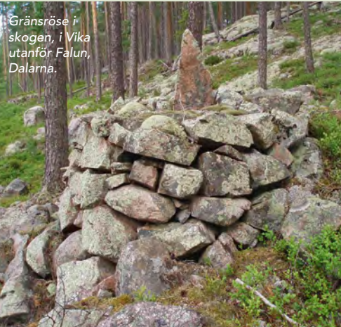
Gränsröse i skogen, i Vika utanför Falun, Dalarna.