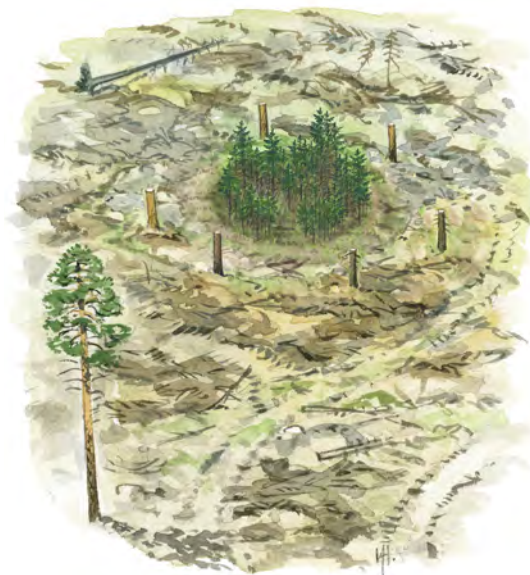
ILLUSTRATION: MARTIN HOLMER

Att lämna så kallade kulturstubbar är ett bra sätt att märka ut fornminnen så att markberedningsmaskinen inte gör skador.