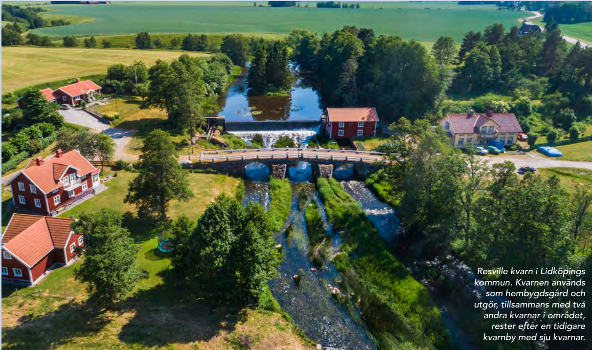
Resville kvarn i Lidköpings kommun. Kvarnen används som hembygdsgård och utgör, tillsammans med två andra kvarnar i området, rester efter en tidigare kvarnby med sju kvarnar.