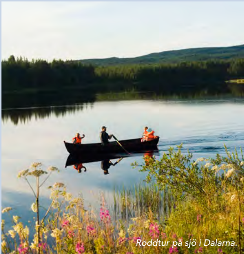
Roddtur på sjö i Dalarna.