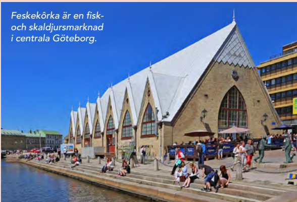
Feskekörka är en fisk- och skaldjursmarknad i centrala Göteborg.