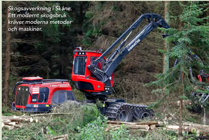
Skogsavverkning i Skåne. Ett modernt skogsbruk kräver moderna metoder och maskiner.