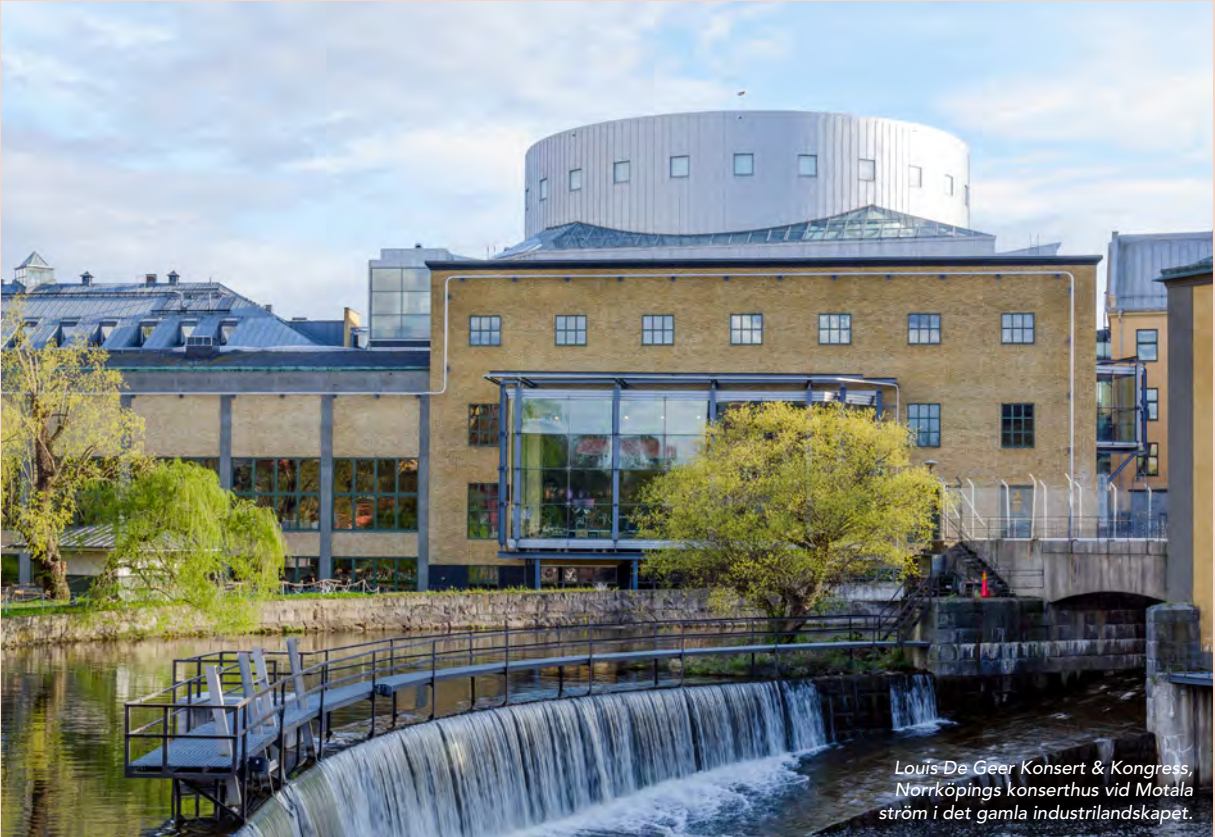
Louis De Geer Konsert & Kongress, Norrköpings konserthus vid Motala ström i det gamla industrilandskapet.