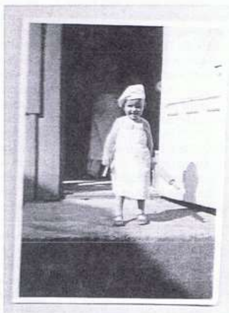
Författaren ca 2 år

av Gun Nilsson (med stöd av mina syskon Ulf och Inga-Britt)