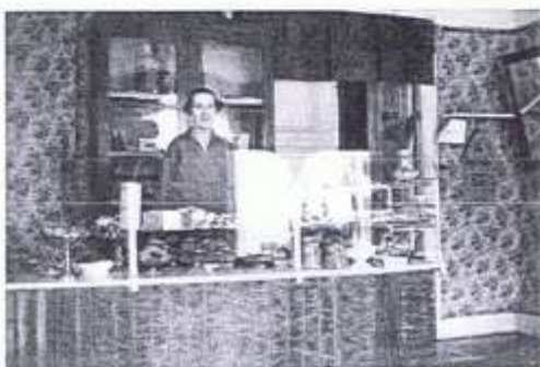
Ester inne på caféet, troligen från när det nyss öppnat

Om ugnen inte hade varit eldad under några dagar så var pappa tvungen att elda en gång extra för att ugnen skulle bli jämnvarm.