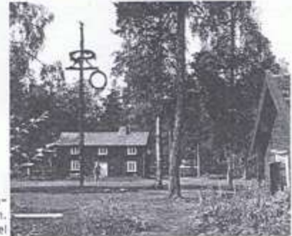
Ljungastugan i Hembygdsparken. T.h. backstugans gavel

Vi hoppas, att Sävsjö Hembygdsförening ska gå en ljus och fruktbar framtid till mötes – "Tillsammans kan vi" som vår kommunala slogan säger.