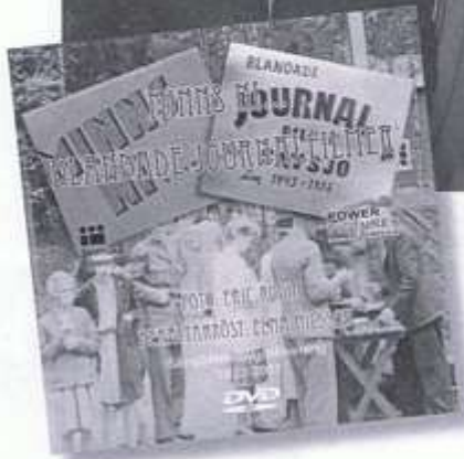
Så här ser DVD-omslaget ut för Rodins filmer.