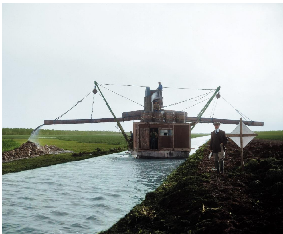
Mudderverk gräver ur Romakanalen 1915–1916