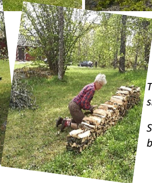
Träd och buskar har växt till sig och behöver glesas ut.