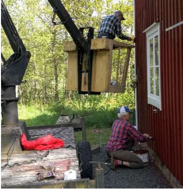
Målningen måste underhållas. Både högt och lågt.

Det fanns en förhoppning om att det trots allt skulle kunna bli någon verksamhet, om inte annat på sensommaren. Hembygdsgården väcktes därför ur sin vinterdvala enligt normala rutiner.