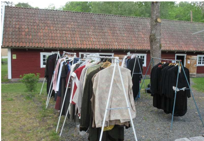
Klädförrådet som finns på ladans vind togs ut för vädring.

När det inte varit någon annan verksamhet på Hembygdsgården har styrelsen och andra medlemmar passat på att göra saker som inte varit möjliga att göra sommartid när verksamhet pågår.