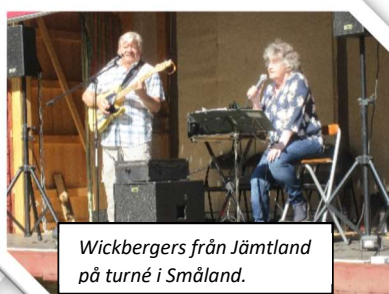
Wickbergers från Jämtland på turné i Småland.