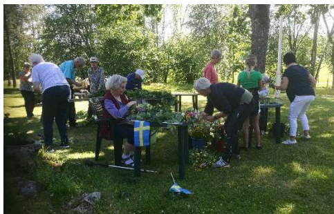
Kvällen före midsommarafton var det full fart med att klä midsommarstången.

Så fick vi äntligen möjlighet att fira årets stora högtid, midsommar, på traditionellt vis. Publiken hade inte glömt bort oss, och stämningen var på topp.