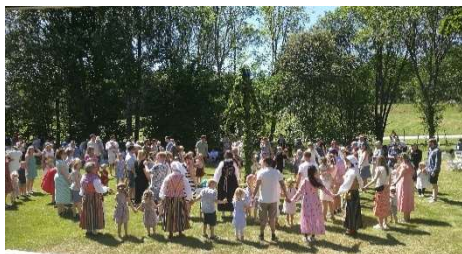
Tenhults folkdanslag uppvisningsdansade och ledde sedan dansen kring midsommarstången.