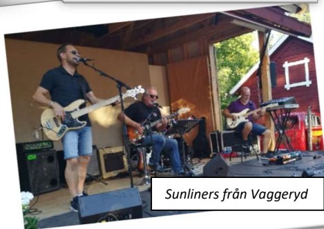
Sunliners från Vaggeryd