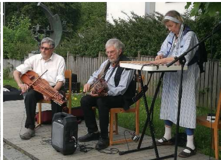
Tenhults folkdanslag underhöll med dans och musik.