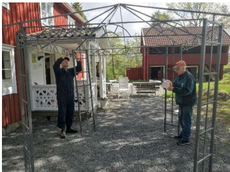
Nytt väffeltält monteras.

I maj var det dags att väcka Hembygdsgården ur vinterslummern. Som vanligt fanns det mycket att göra för att Hembygdsgården skall bli klar för sommarens aktiviteter.