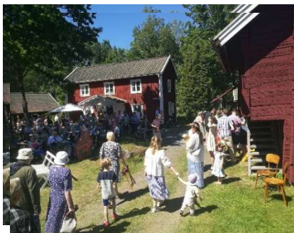
På midsommarafton strömmar publiken till.