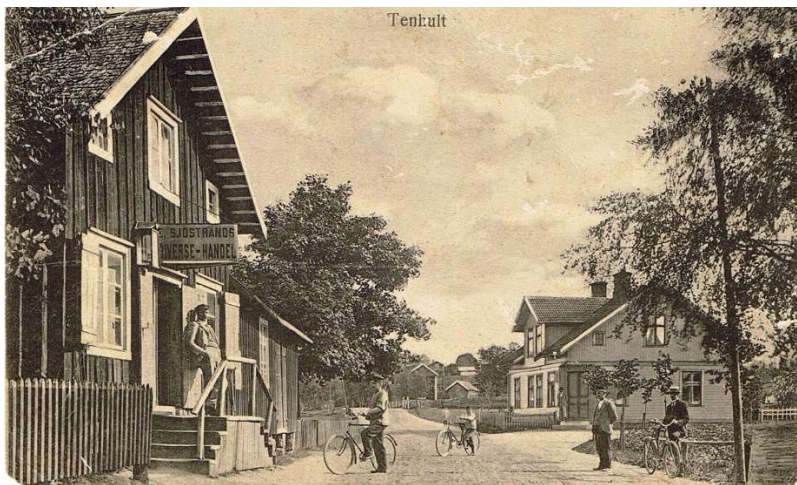
Sjöstrands diversehandel tidigt 1900-tal. Till höger Henriksdal (Appelquists bageri).

1971 skapas torget med en ny affärsfastighet. Fastigheten inrymde då Konsumaffär, Postkontor, Sjukhus och Folkhälsovård.