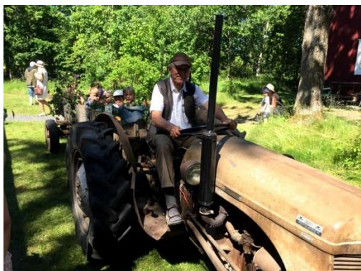
Barnens förtjusning var att få göra en åktur på vagnen efter den gamla "Grållen".