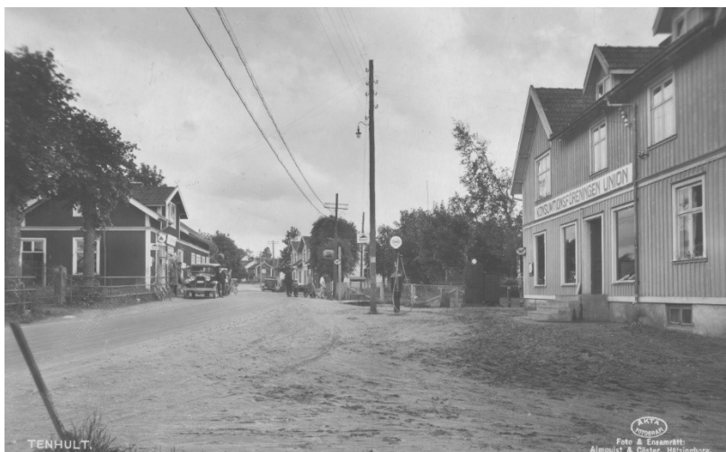
Sjöstrands diversehandel till vänster och Kooperationsföreningen Union till höger. Observera att båda affärerna har bensinpumpar.