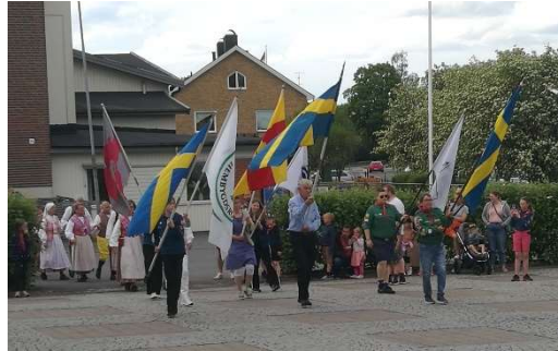
Här sker inmarschen till tonerna av Allians Brass.