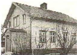
Betel i Krokombyggen (11)