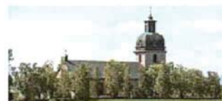
Rödöns kyrka (4)

1927 byggdes den andra frikyrkolokalen i Ås vid Ösavägen (nuv Mattssons traktor). Redan 1856 hade något speciellt och nytt på den kristna fronten hänt i Jämtland. Det första baptistiska dopet ägde rum just här i Ås den 30 november det året i ett upphugget hål i Storsjöns is. Samma dag bildades här också länets första baptistförsamling. I början saknade man dock egen samlingslokal och en stor del av verksamheten flyttades därför snart till Aspås, där det också fanns en baptistförsamling. 1891 bytt man namn till Aspås baptistförsamling. Där byggde man ett eget kapell först 1908 och 1927 fick alltså även baptisterna i Ås ett kapell. Detta kom 1945 kom att övertas av Östersunds baptistförsamling. Omkring 1950 såldes huset till en privatperson, men står fortfarande kvar vid Ösavägen som Mattssons traktor.