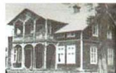
Betel i Trångsviken (23)