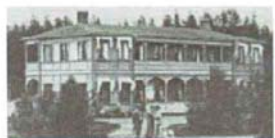
Tillfälligt baptistkapell i Ytterån (19)