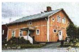
Missionshuset i Nälden (15)