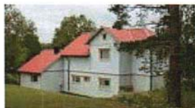
Betania i Nälden (16)