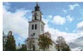
Alsens kyrka (21)