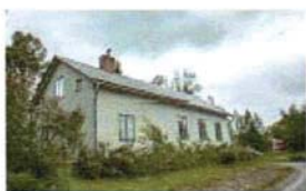
Missionshuset / Baptistkapellet i Ytterån (18)