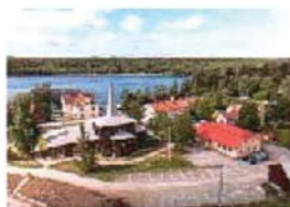
Krokoms kyrka (10)

1946 tog Svenska Kyrkan över byggnaden och den kom sedan att brukas som gudstjänst- och verksamhetslokal och kallades oftast Kyrksalen fram till 2011, då den på grund av vattenskador nödgades att rivas och ersättas av en ny kyrka på samma tomt 2013