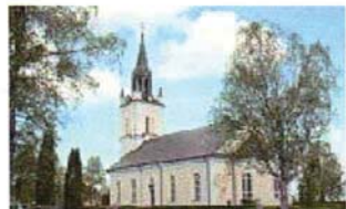
Ås kyrka (1)