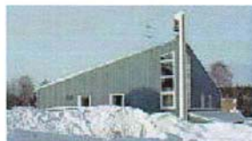
Näldens församlingshem (17)