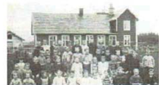
Missionshuset i Hägra (6)