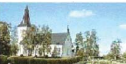
Näskotts kyrka (14)