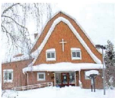
Krokoms kyrka "Kyrksalen" 1946-2011