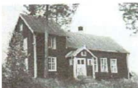
Frälsningsarméns kårlokal i Nyheden (8)