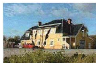
Baptistkapellet i Ås (3)

1905 byggde Östersunds missionsförsamling ett missionshus i Ås (bakom f d BP-macken i Sörbyn) och bildade 1919 en dotterförsamling här. Men redan 1926 återgick medlemmarna till moderförsamlingen. Själva huset såldes först omkring 1969 till en privatperson och finns fortfarande kvar.