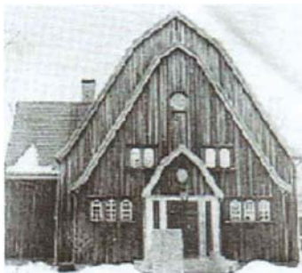
Baptistkapellet i Krokoms (9)