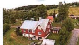
Filadelfiakapellet, tidigare Elim, i Alsen (22)