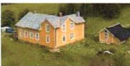
"Kapellet" i Aspås (13)