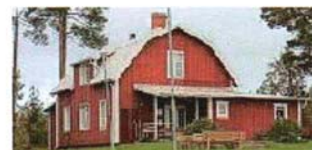
Backens bönhus (5)

En urkund från 1314 omnämner en kyrka i Rödön, som sedan byggts ut flera gånger. 1806-1811 under oroliga tider i landet byggdes så den kyrka, som kom att stå i drygt 100 år. 1923 totalförstördes kyrkan av en explosionsartad brand. 1926 påbörjades ett nytt kyrkbygge och i augusti kunde den nuvarande kyrkan invigas.