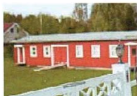
Svenska Kyrkans gudstjänstlokal i Dvårsätt (7)