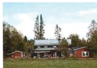
Missionshuset i Ås (2)