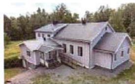
Pingstkyrkan i Ytterån (20)