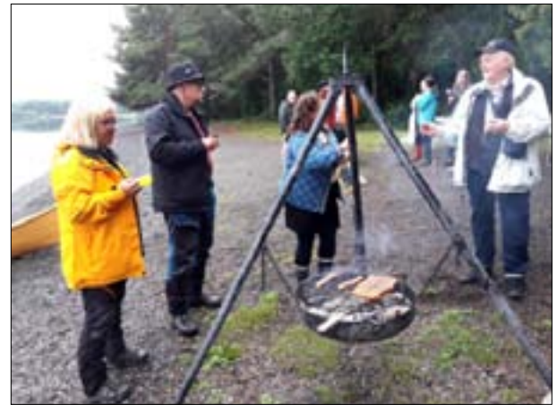
Samtal runt korvgrillningen