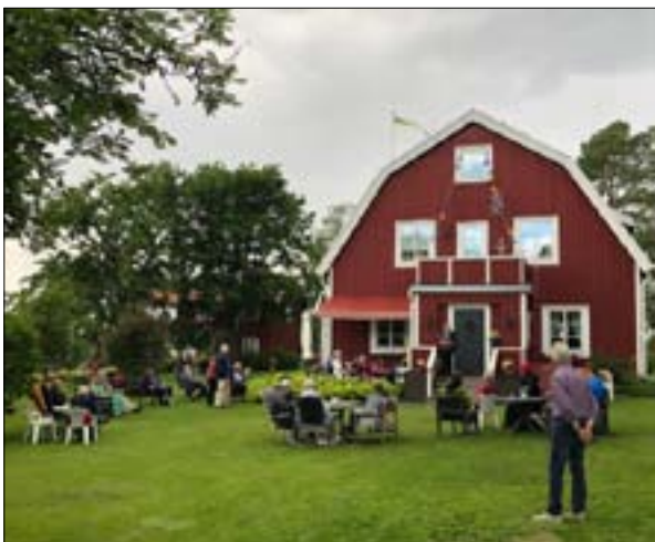
Innan vandringen startade gjorde Sigrid en omfattande inledning till vandringen.

De som tyvärr inte kunde delta fick en ny chans någon vecka senare.