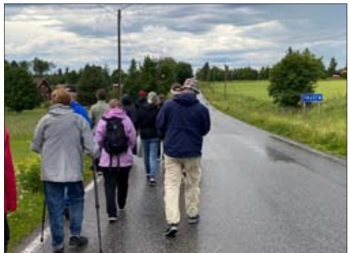
På återväg till startplatsen för vandringen.