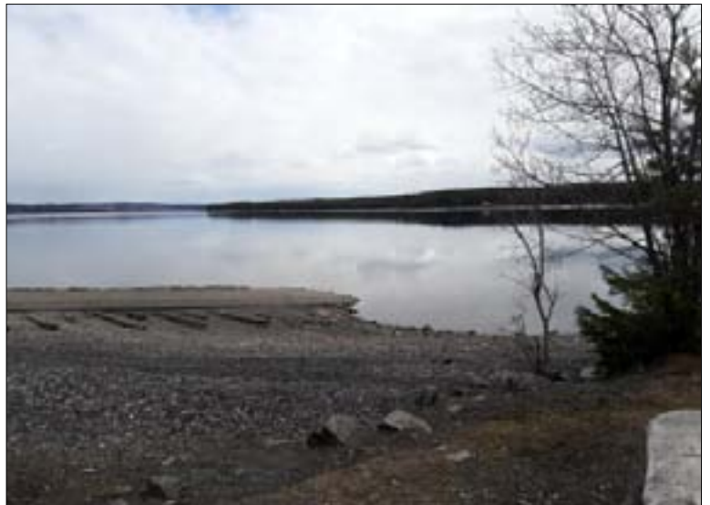
Bra förutsättningar att upptäcka något vid vår spaning.

Vid vindskyddet i viken nedanför Tibrandshögen fick vi höra ett antal personer som vittnade om hur de varit i kontakt med Storsjöödjuret. Vi avslutade med att grilla korv som var och en tagit med sig.