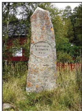
Stenen har rests av tacksamma trafikanter

På lördagsmorgonen började man bli oroliga hemma i Rödön när de inte kommit hem och började undra vart de tagit vägen. En äldre kvinna i Bergtorpet (kan vara nuvarande Hjälmortpet) hade hört rop på hjälp under kvällen. Man började därför söka efter de saknade i närheten av Kycklingholmen. Ett 45-tal båtar deltog under en vecka i dessa eftersök. Det draggades men utan resultat.