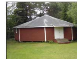
Dansbanan var en viktig del i verksamheten. På söndagskvällarna var danserna välbesökta. På söndagarna var konkurrensen från andra ställen liten. De värnpliktiga på flyget hade kommit tillbaka från helgedigheten. Här spelade de populäraste Jämtlands- orkestrarna.