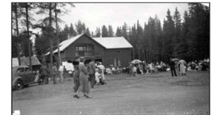
Edit var en driftig person som ordnade allehanda tillställningar för att locka folk till serveringen. Hon ordnade dansuppvisningar, boxning osv. På höstarna surströmmingskalas där gästerna kom med ångbåt från Östersund.