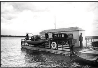
Den handdrivna färjan ersattes 1925 av en motordriven. Den var i drift fram till 1950 då den ersattes av en något större (för fyra bilar)

När isarna frös till på hösten stakade man en isväg över sundet. Den användes både av gående och hästskjutsar. Så var det till 1938 när Storsjön reglerades. Då flyttades isvägen till sträckan Undrom-Västbyviken, alltså en bra bit ut på Storsjöflaket