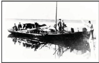
Från början var det enkla roddfärjor som senare kom att förses med segel. 1900 fanns det tre sådana färjor i sundet. Den största kunde ta tre hästar och kärror

Med Frösön som centrum i Jämtland har trafiken över Rödösundet varit mycket viktig. Den öppnade vägen från Frösön mot Västra Jämtland och mot Norge. Sommartid har man använt enkla färjor och på vintern var det vinterväg över sundet