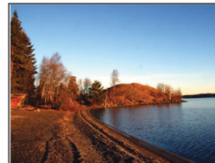
På Tibrandshögen finns resterna av en borg (Tibrandsholm) från 1300-talet. Här huserade den danske fogden Tibrand. Viken framför går under namnet "Galgbäcksviken" eftersom det var en avrättningsplats ovanför viken. Numera är viken en välbesökt badplats.