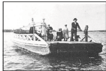
1900 kom den första riktiga färjan med styrlina. Den var byggd av trä och drogs för hand

Fram till ungefär år 1900 var det böndernas uppgift att sköta vågar och även färjor. Ansvaret togs då över av vägdistriktet. För att finansiera verksamheten fick trafikanterna betala en avgift.