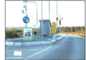
Bron kostade ca 60milj. att bygga. Staten var beredd att ställa upp med 40 milj. Resterande 20 milj. betalades med ett lån som ett nybildad brobolag tog upp med borgen från berörda kommuner och några lokala bolag. Intäkterna skulle komma från broavgifter. För personbilar kostade det 16 kr per överfart. För bussar och lastbilar betydligt mera.