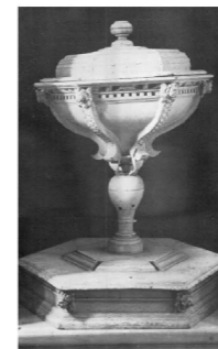
Dopfunten från 1600-talet kunde räddas