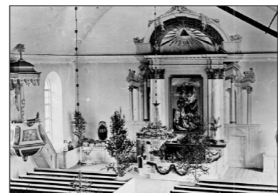
Interiör från den brunna kyrkan