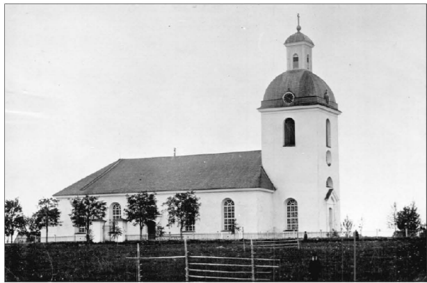
Rödöns kyrka 1895-98