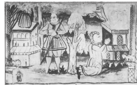
Del av väggmålning som upptäcktes vid branden 1923

Efter branden visade sig takrika spår efter den medeltida kyrkan. I långhusets östliga mur framträdde en igensatt hög och smal fönsteröppning med svag spetsform.