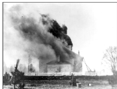
Kyrkan brinner 1923

Rödön är känt som kyrkplats sedan 1300-talet. I den nuvarande kyrkan finns resterna av en medeltida kyrka. År 1810 utvidgades kyrkan och byggdes helt om. 1923 eldhärjades den så att endast murarna var kvar. Den byggdes upp och stod färdig 1927.