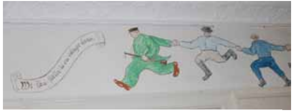
Vi ska ställa te en roligers dans.