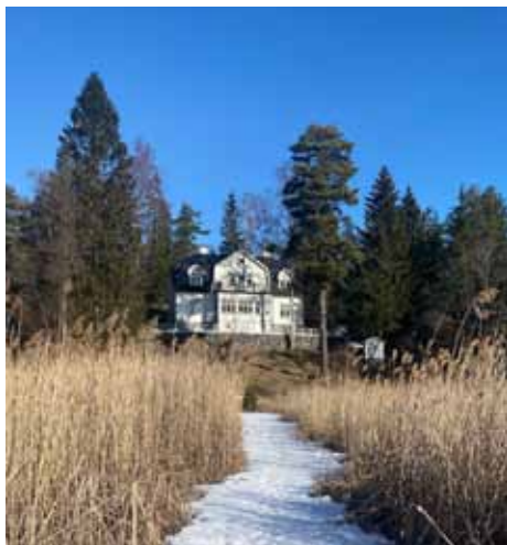
Solvik från Rumsättrasjöns is

hus i Rumsättra, det ligger lite avsides vid norra stranden av Rumsättrasjön och kallas i dag Solvik. Det här var innan sjön sänktes och utsikten bjöd på en vacker vy över en öppen vattenspegel. Huset sticker ut, då det har en annan form än andra bostadshus som byggs i Riala vid den här tiden. På en murad stengrund med källare byggs i sluttningen ett tvåvåningshus, där övervåningen ligger under ett brutet tak. Ingången är från norr.