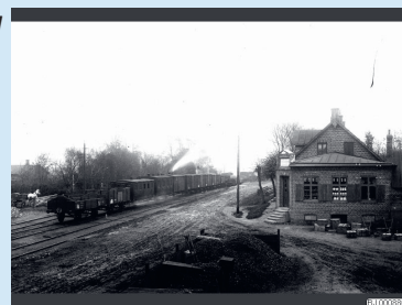
Oxie station och lanthandel.

OHH kan hjälpa till och skanna av bilder och film. Hör av er!