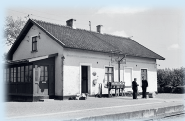
Västra Klagstorp 1940-talet.