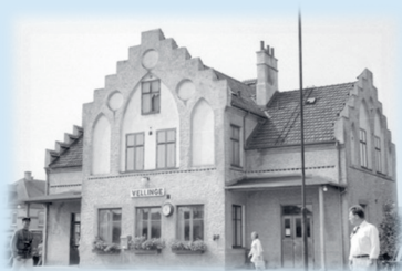
Vellinge 1971.

Vi kommer även att ta upp detta tema under årets cirkelträffar.