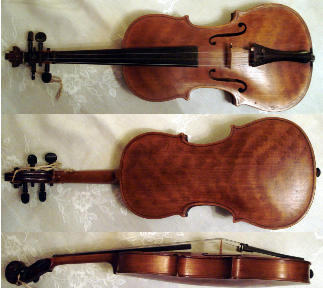
Olof Larsson 1877