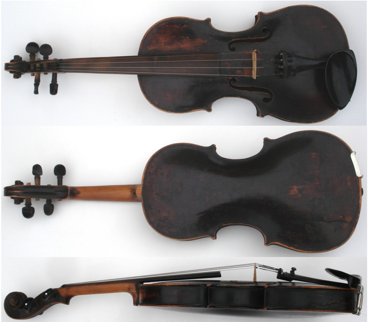
Olof Larsson 1877