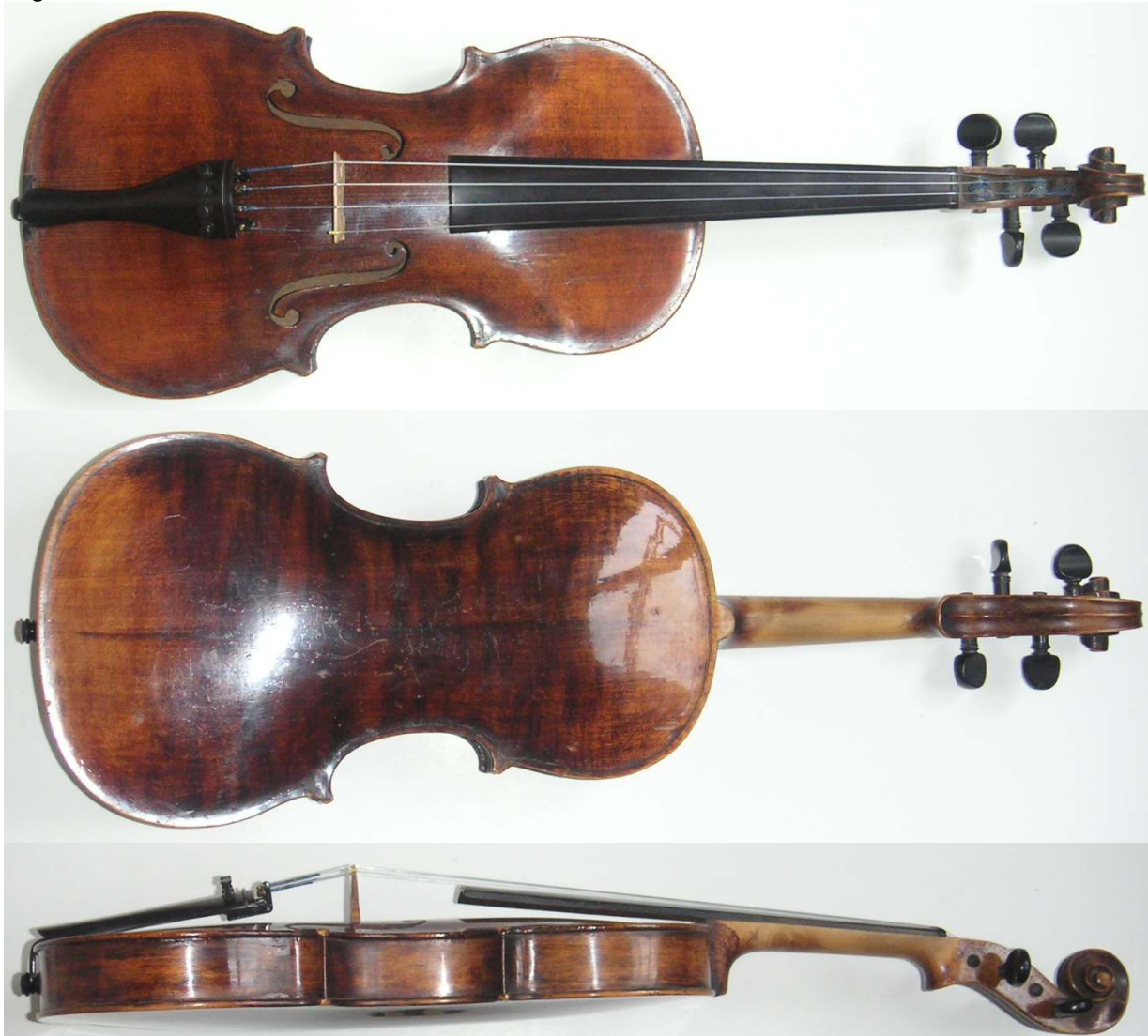
Olof Larsson 1877