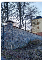
Löfstad slott, Norrköping