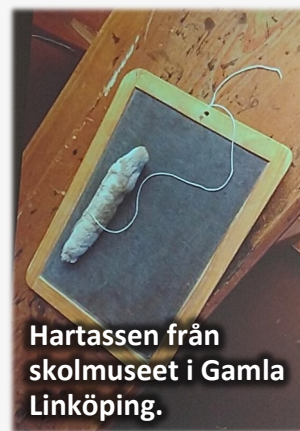
Hartassen från skolmuseet i Gamla Linköping.