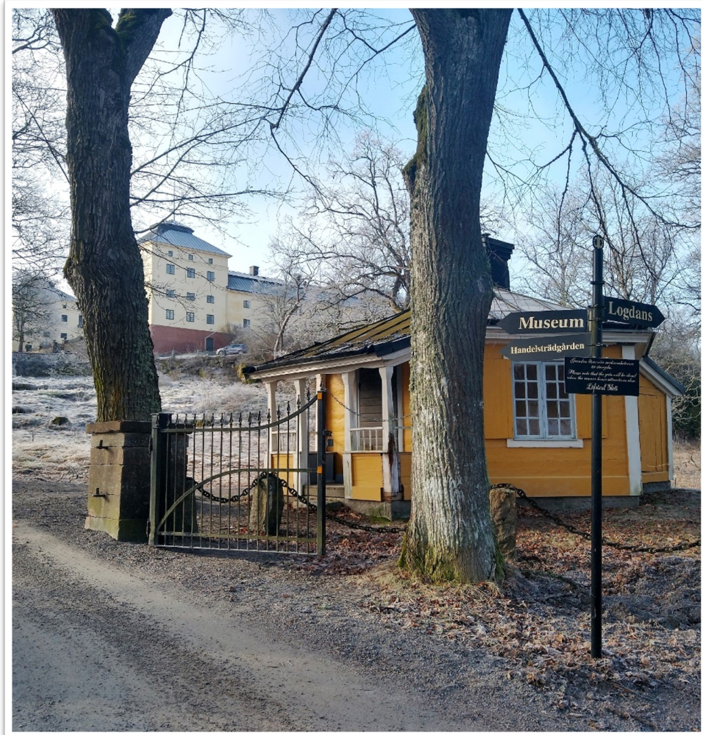
Infart till Löfstad slott, Norrköpings kommun