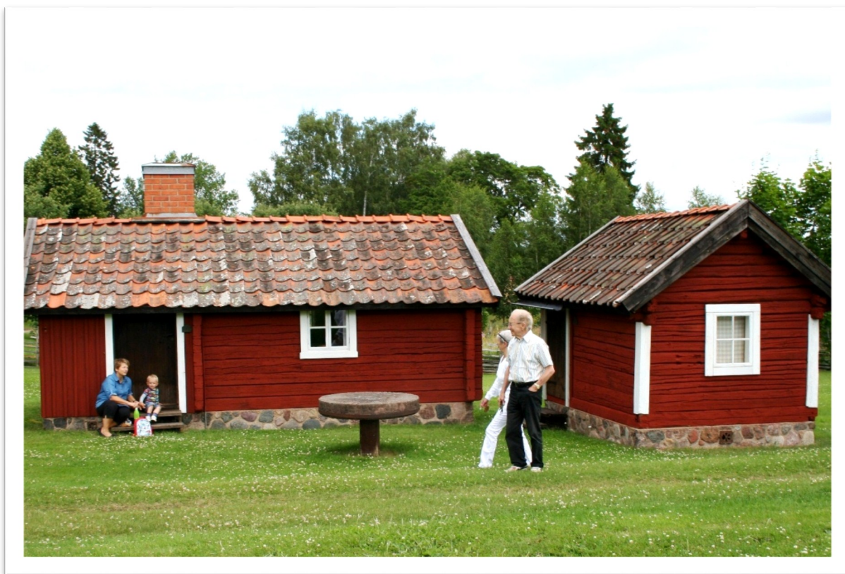
Försommarpromenad på Kärna hembygdsgård, Malmslätt, Linköping.

En härlig sommar önskas alla hembygds läsare!