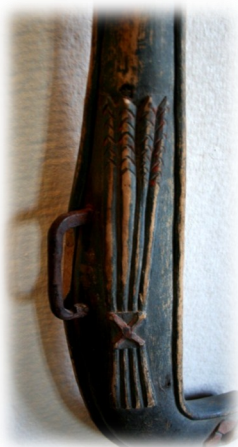
Fint slöjdat dekor på ett gammalt bogträ.

En vackert rotflätad korg eller en färggrant målade blombukett på ett hörnskåp kan nog vem som helst enkelt notera och njuta av. Men för ett otränat öga kan annan folkkonst vara lätt att missa. Dekor kan skönjas som exempelvis ett snirkligt format handtag på ett klappträ, ett räfflat ruttmönster på ett dörrgångjärn, ett diskret hjärta utskuret i en plåtlykta eller ett stilslöjdat sädeslag på ett bogträ. Till och med en sydd och stoppad lockfågel för jakt, förklädd till tjäder, kan klassas som folkkonst.