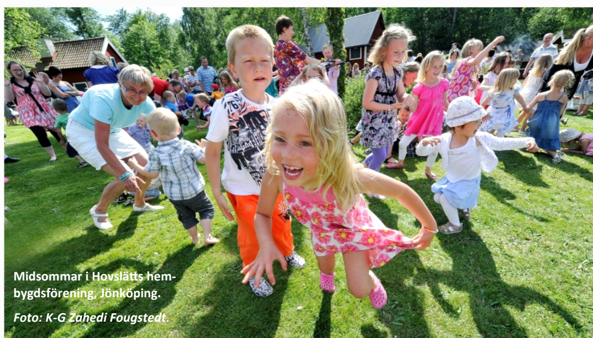
Midsommar i Hovslätts hembygdsförening, Jönköping.