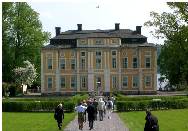
Steninge slott, Sigtuna.

Resan gick vidare till Steninge slott, en av svenska barockens pärlor. Lunch i den vackra stenladugården och vandring i parken där monumentet av Axel von Fersen d.y.