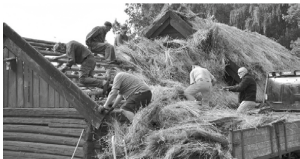
Rivning av halmtak på fornhemmet i Bjärka-Säby, Wist Hembygdsförening 2011.

Syftet med stödet är att utifrån landsbygdens resurser skapa möjligheter för rekreation för allmänheten och förbättra möjligheterna till turism – exempelvis till information för få fler besökare till landsbygden, till vandringsleder eller till skyltar, broschyrer och webbplatser om bygden och dess natur- och kulturarv.