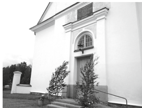
Sunds kyrka prydd för midsommar.

Översättning: Jesper Ström.