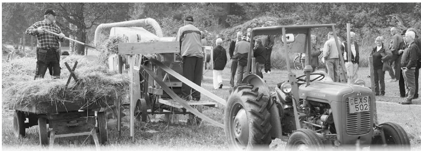
Nykils Hembygdsförening bedriver jordbruksprojekt 2014-15.