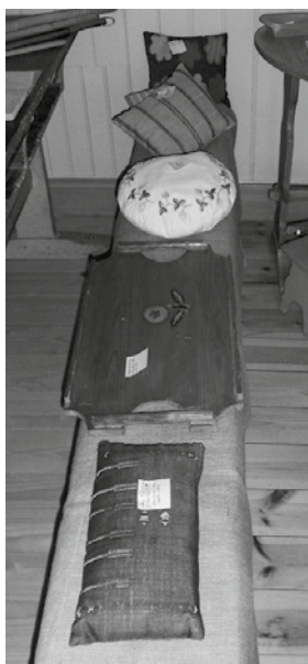
Kuddar tillverkade på 1960-talet, bl.a. i Holmens skola 1959-60.

Grytlappar, en i rätstickning och en i rutigt mönster med virkade kanter, var obligatorisk. Jag minns ännu vandan när min grytlapp blev sned och stickorna inte lydde mina svettiga fingrar. Fröken kunde inte riktigt förklara utan mamma fick lära mig