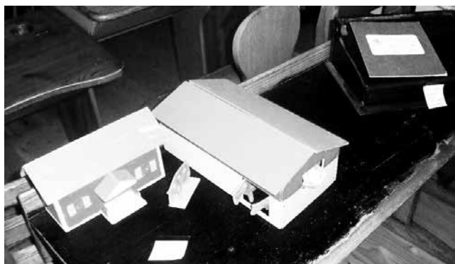
Miniatyrlantgård med djur, från Perstorps skola.

Från Röks skola har vi fått slöjdade välgjorda föremål; en handdukshängare, en tomahawk mm. Och så pallar i olika storlekar och modeller, till synes väl använda. I Perstorps skola fick man göra en lantgård med djur och staket omkring, målad i glada färger. I Svanshals Kyrkskolan är en ljuslampa i trä tillverkad.