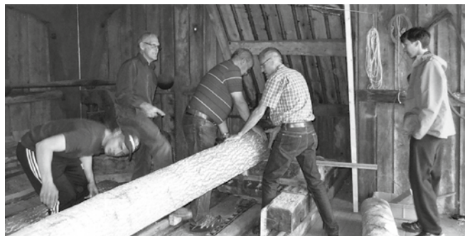
Restaurering av Norrgårdssågen på Mjölby hembygdsgård sept 2013.

Sveriges Hembygdsgårdar tycker att det är viktigt att hembygdsgårdarna verkligen kan använda stöden. Detta gäller särskilt stödet för utvecklingen av hembygdsgårdarna, och att alla dess avsatta medel kommer till an-