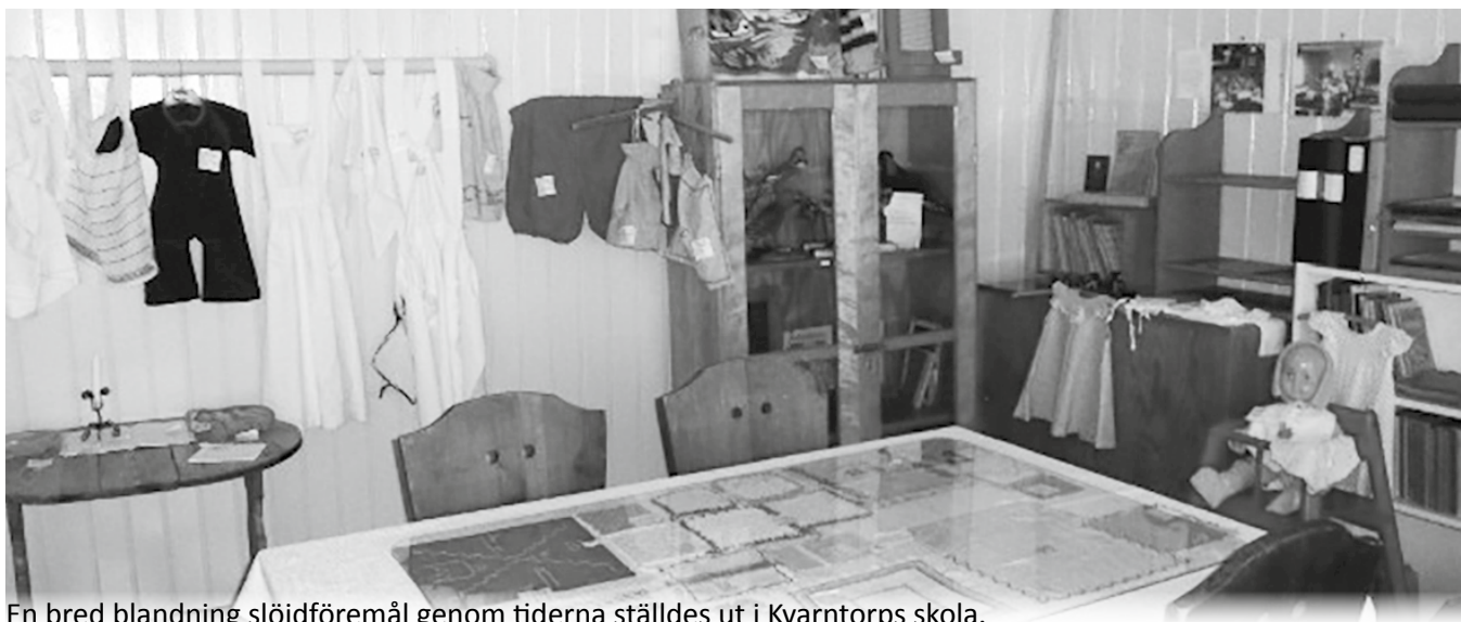
En bred blandning slöjdföremål genom tiderna ställdes ut i Kvarntorps skola.