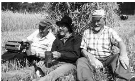
Välbehövlig kaffepaus mellan arbetspassen.

Åkern hade plöjts upp för att vara färdig för harvning. Ett ekipage parhästar och en ebbetshäst harvade så att en mullrik såbädd tillreddes. Därefter var det dags för en välbehövlig vila för hästarna och publiken slog sig ned i grässlätten och tog fram sina korgar och ett välsmakande kaffe.