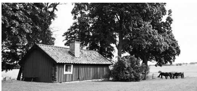
Hembygdsgården Smällen, Normlösa Hembygdsförening.