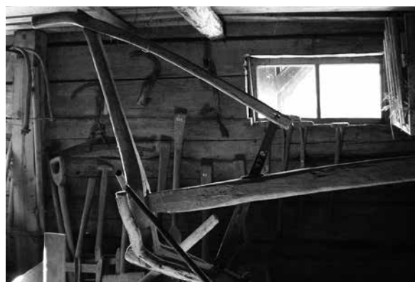
Äldre plog hos Malexanders Hembygdsförenings samlingar.

1939 hette rörelsens tidsskrift ”Bygd och Natur” för att spegla de två hörnstenarna i hembygdsarbetet; bygdevården och landskapsvården.