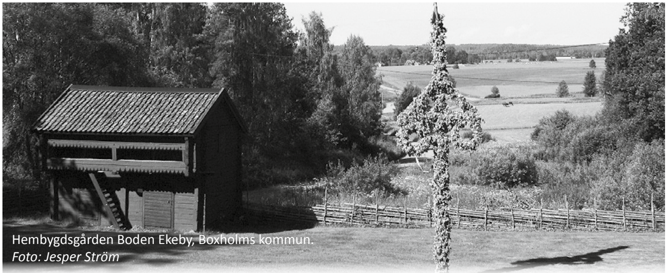
Hembydsgården Boden Ekeby, Boxholms kommun.