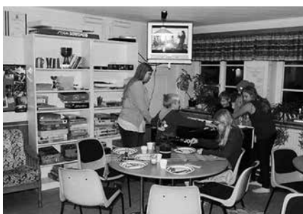
Full aktivitet i Älvestads Fritids- & Ungdomsgård.