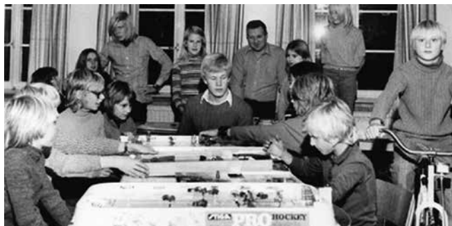
Fritidsgården år 1974.