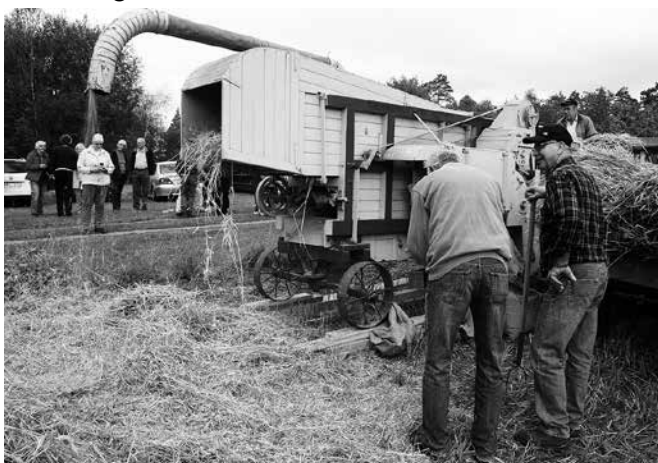
Tröskning i full gång.

I veckan före körde Sölve, Göte och Lennart fram tröskverket från ladugården och ställde upp det ute på åkern. Det var mycket som skulle kontrolleras och justeras. Rätt såll skulle sitta i och ett avlastningsbord skulle monteras upp. Det visade sig att en rem var trasig och måste köpas in. Fastän tiden var knapp lyckades affären Östergyllen få fram rätt rem och den kunde monteras kvällen före tröskardagen.