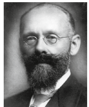
Karl Erik Forsslund, en av hembydströrelsens grundfigurer.

I ett Sverige som snabbt omformades i grunden genom urbanisering och industrialisering syntes snart modernitetens avigsidor. En radikal modernitetskritik uttrycktes av företrädare som Ellen Key, Elin Wägner och Viktor Rydberg. De såg hur landsbygdens gemenskap och harmoni med naturen hotades av industrierna som stängde in människorna i sot, likformighet och misär. De varnade för industrisamhället som livsform med en ökande materialism, egoism och konsumtion som riskerade att förminska utrymmet för bildning, andligt liv och konstnärliga uttryck.