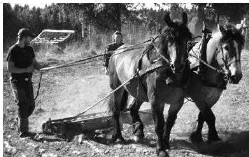
Harvning i samarbete med Nykils Rid- och körsällskap.

120 personer besökte första gemensamma samlingen som genomfördes hösten 2013.