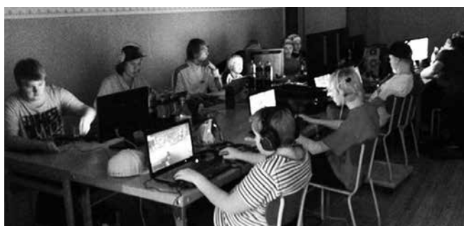
Ungdomarna träffas ibland i fritidsgården för en datoranvändarträff, ett s.k. LAN-event.

Ungdomsgården är öppen måndagar och torsdagar mellan 18-21 under höst- och vårterminen, men stängd under sommarlovet (undantag finns, som t.ex. 2013 då man anordnade ett sommarläger i Sankt Anna). I lokalerna finns både innebandyplan, biljardbord och flipperspel. Resor har gjorts till Bodaborg i Karlskoga och Sävsjö, samt till bad i Linköpings simhall. Man har också anordnat LAN (Local Area Network) och filmkvällar under alla skollov, med övernattningar i bygdegården. Uppslutningen är stor med upp till 30 deltagare vid vissa aktiviteter, och ungdomarna verkar vara väldigt nöjda med sin fritidsgård. Även upptagningsområdet är stort, med deltagare från flera omkringliggande socknar.