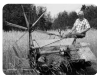
Jordbruk på hembygdsvis i Nykil