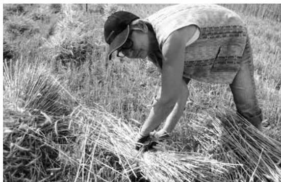
Insamling av neker.