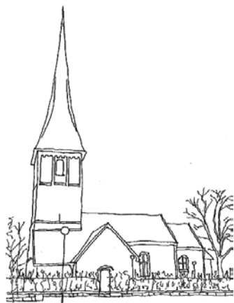
Kaga kyrka utanför Linköping, en typisk romansk landsbygdskyrka från 1110-talet med torn i väster, följt av långhus och lägre och smalare kor samt absid längst i öster.

Men jag vill framför allt uppehålla mig vid två mera närliggande fall där nya religiösa idéer snabbt materialiserats i byggnader för utövande av de nya idéerna: Först byggandet av ett stort antal romanska stenkyrkor på Östgötaslätten under 1100-talet, och sedan spridningen av cistercienserorden och dess kloster över hela Europa med förgreningar i Sverige under i stort sett samma tid.