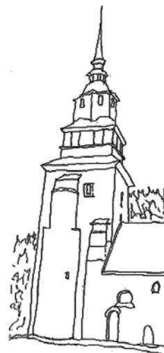
Örberga kyrka i Östergötland är, liksom Husaby i Västergötland, försedd med två extratorn med spiraltrappor.

Av ett diagram i boken ”Östergötland, landskapets kyrkor” kan man utläsa att det under perioden 1100 – 1350 byggdes i genomsnitt 5,5 kyrkor i Östergötland per årionde, dvs mera än 130 kyrkor. De flesta var stenkyrkor, men enstaka var byggda i liggande timmer som den ännu bevarade Tidervals kyrka. De första decennierna av 1100-talet var den mest intensiva stenkyrkobyggnadsperioden. Årsringsdateringar har gjorts i trävirket i flera kyrkor i Vadstenatrakten, där t ex Herrestad kyrkas takstolar kunnat dateras till omkring 1112 och en torntrappa i Örberga kyrka till vintern 1116 – 1117.