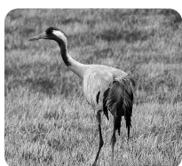
Trana på vårutflykt