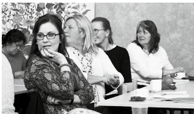
Seminarier kombinerades med Workshopar i Missionskyrkans lokaler.