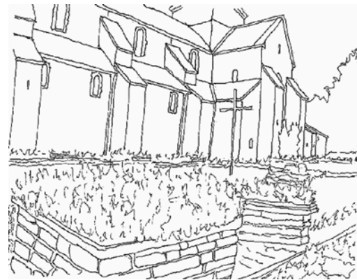
Ruinerna av Varnhems cistercienser kloster i Västergötland, särskilt korsgången och klostergården i förgrunden, och den senare ombyggda klosterkyrkan i bakgrunden.