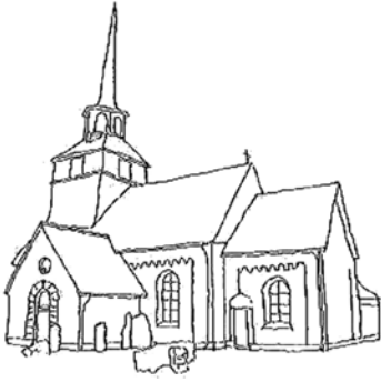
Järstad tegelkyrka, med ursprung i 1200-talet och belägen i Östergötland.

titta på en av dem – cistercienserorden – som dessutom gjorde stora avtryck i Sverige.