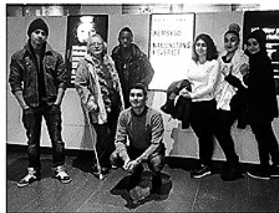
Unga Hembygdsambassadörer fick diplom på Historiska Museet i Stockholm Sex nyblivna unga hembygdsambassadörer från Värby fick diplom för att de under hösten har genomfört en utbildning om hembygden, guidning och friluftsliv. Utbildningen var ett samarbete mellan Värby-Fittja Hembygdsförening och Huddinge Kommun och avslutades med ett besök på Historiska Museet som just nu visar utställningen Hembygd – någonstans i Sverige. Nu planeras för ett ungdomsutbyte med ungdomar i andra hembygdsföreningar och kanske även internationellt.

www.hembygd.se | Tipsa en vän | Prenumerera | Avprenumerera