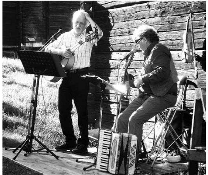
Tänk på vad som spelas, och när det spelas vid era hembygdsevenemang.

Läs mer om hur STIM fungerar på www.stim.se .